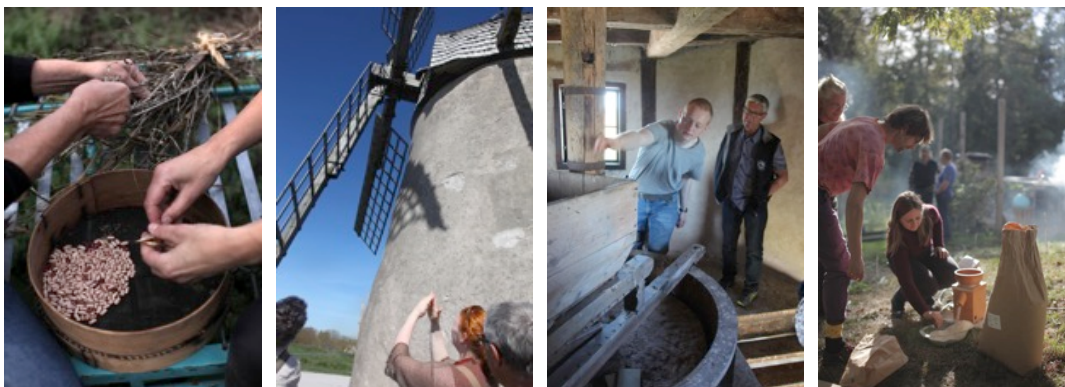
Kunskap är makt, plats är politik , studiecirklar i Slite och Kappelshamn.

Sonjasdotter genomförde även en workshop under BAC:s ungdomsprojekt I Båtflyktningarnas Spår .