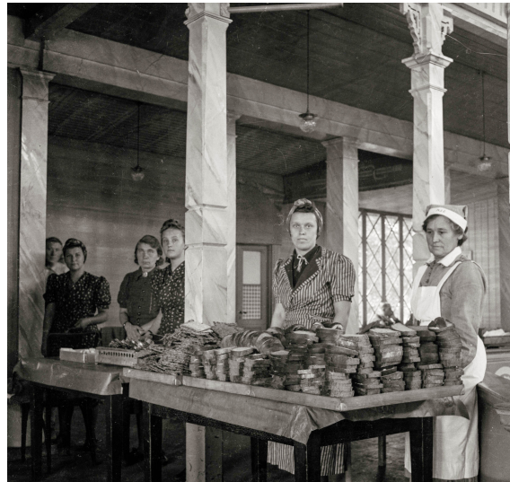
I Båtflyktningarnas Spår. Fotografier: St. Hansskolan och Paviljongen i Visby 1944–45.