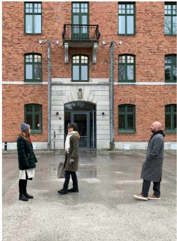
Rundturer med konstnärer i Visborgsområdet.