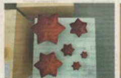
Ena korgarna är till för konstnärerna som vill visa på den stora konstnärliga världen.