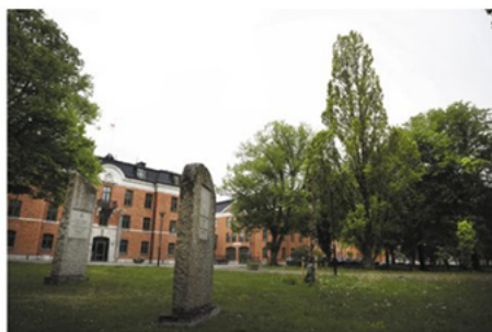
Stadsdelen Visborg ska utvecklas, med start år 2020.

Projektet, "Konst i stadsutveckling", är ett finansiellt samarbete mellan Statens konstråd och Region Got-