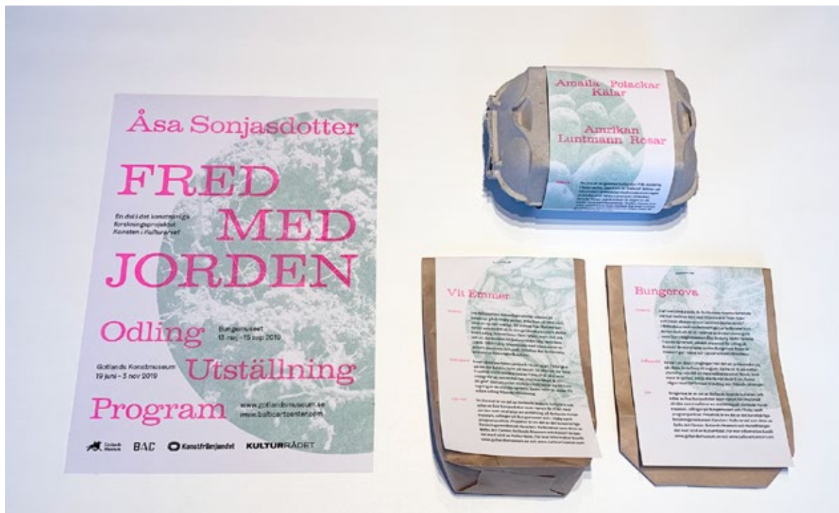
I samarbete med Konst&Teknik i Stockholm togs det fram en grafisk profil till projektet.