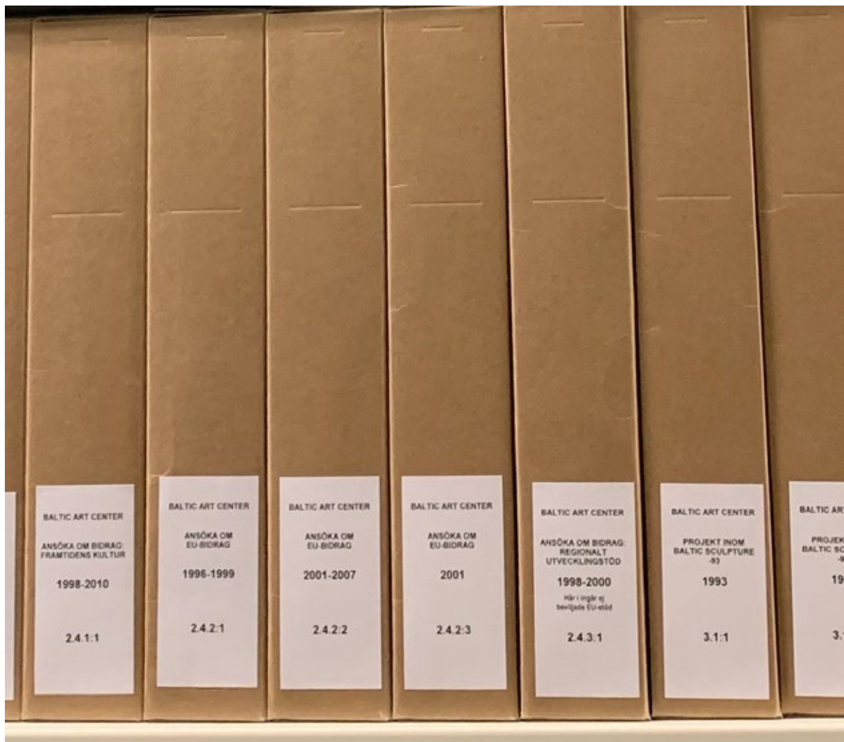
Slutarkivering på Regionarkivet på Gotland.