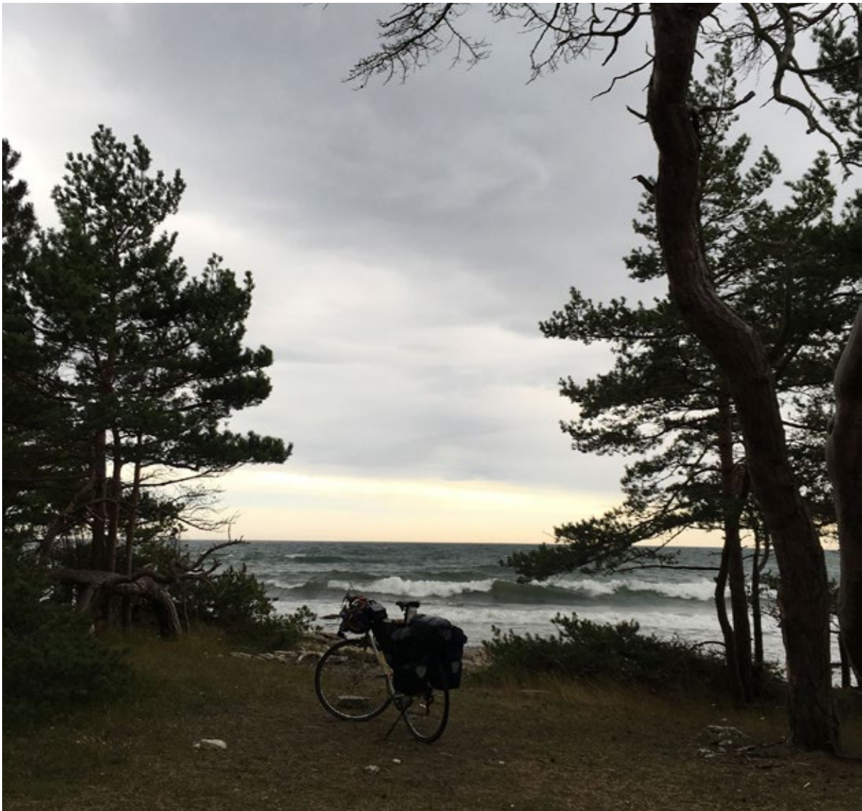
Norra Fårö.

Sebastian Stumpfs residens var producerat i samarbete med Goethe-institutet.