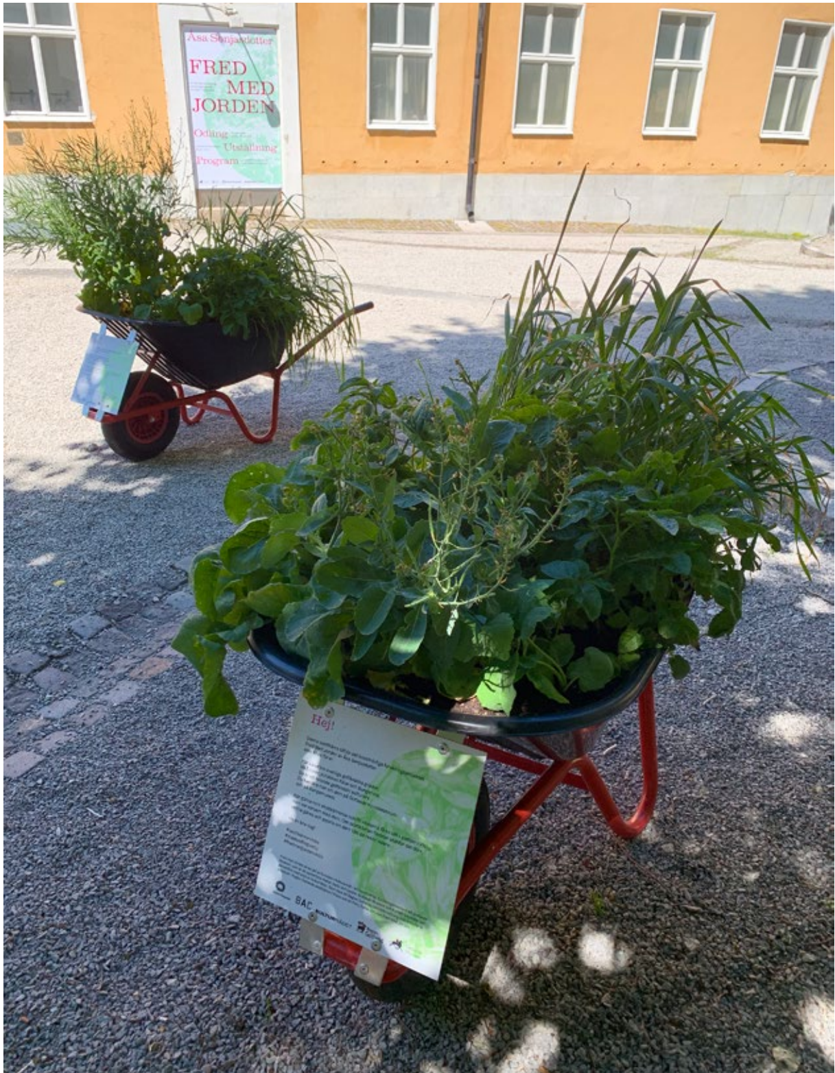
Odlingar av emmervete, potatis och rovor i Region Gotlands skottkärror i Visby, sommaren 2019.