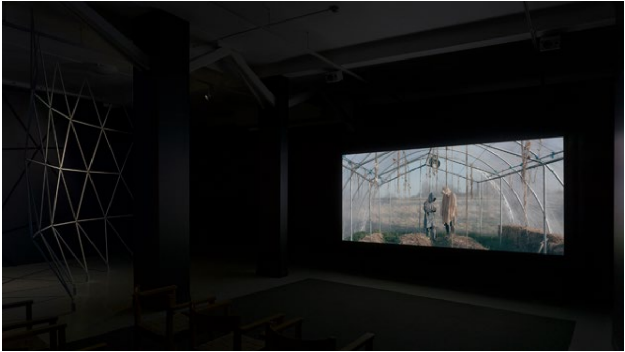
Utställningsvy, Lithic Choreographies , Gotlands Konstmuseum, 2018.