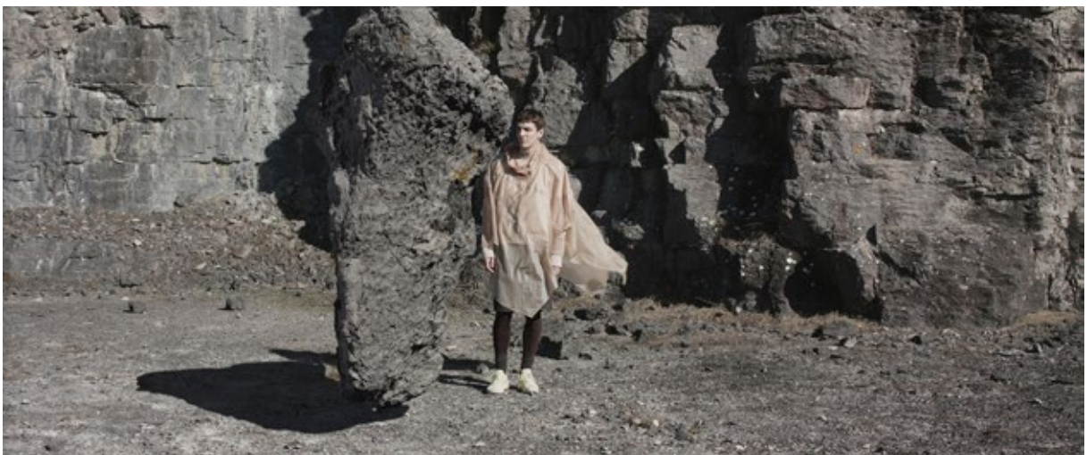
Stillbild ur Lithic Choreographies , Sam Smith, inspelad på norra Gotland 2018.

I utställningen Lithic Choreographies på Gotlands Gotlands konstmuseum, åtföljdes filmen av installationer av objekt från filmen tillsammans med flera nyproducerade verk i form av fotografi, texter och video.