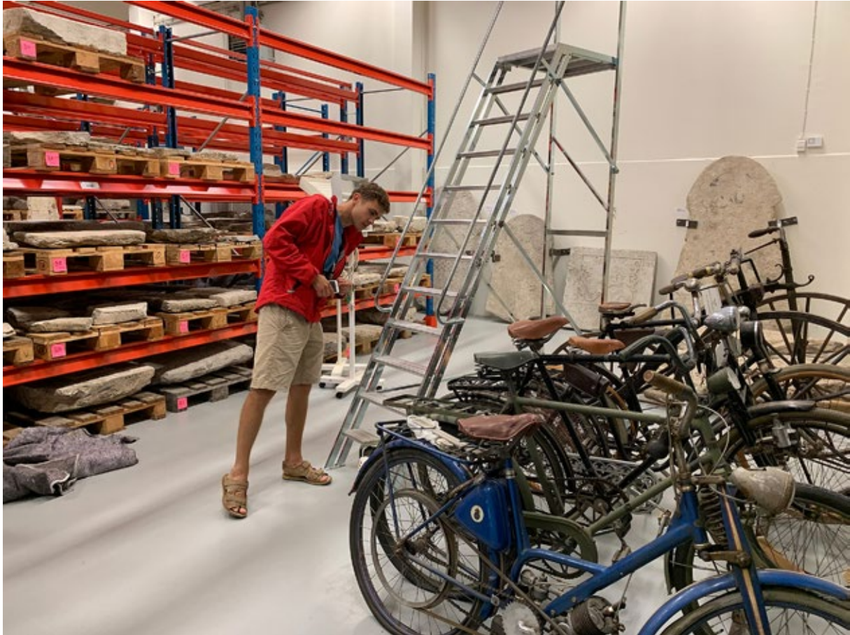
Augustas Serapinas i Gotlands Museums samlingar, 2019.