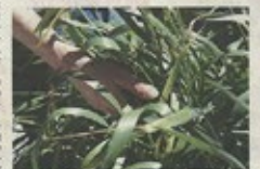
Här "Fred med jorden" har man tillåtit växterna att växa som de vill.