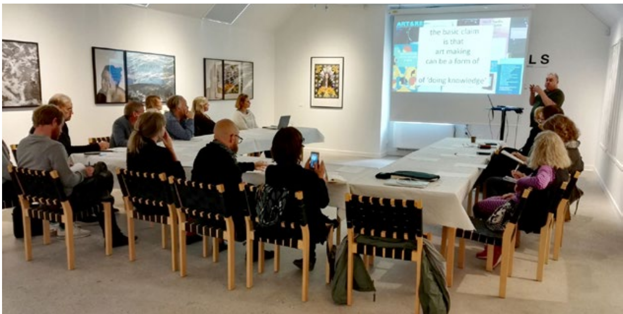
Bilder från seminariet, september 2019.