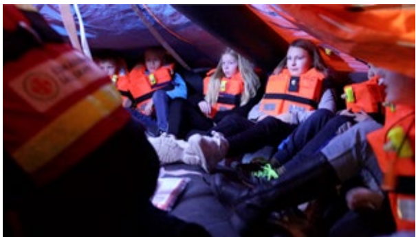
Bilder från Utflykten , på Bergmancenter november 2019.