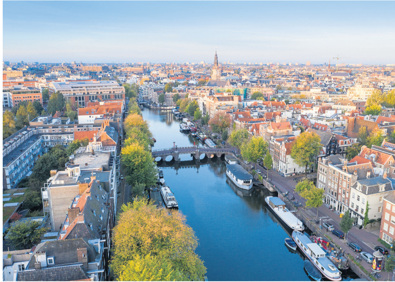
Amsterdam, wat beskou word as 'n tegnologiese spilpunt in Europa en gesog is onder werkers in inligtingstechnologie.