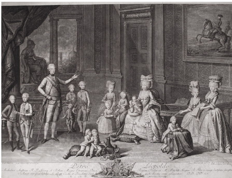
G. Piattoli (disegnatore), G. A. Fabbrini (pittore), A. Nistri Tonelli (disegnatrice), G. B. Cecchi e B. Eredi (incisori), Ritratto della famiglia del granduca Pietro Leopoldo, 1785, incisione.