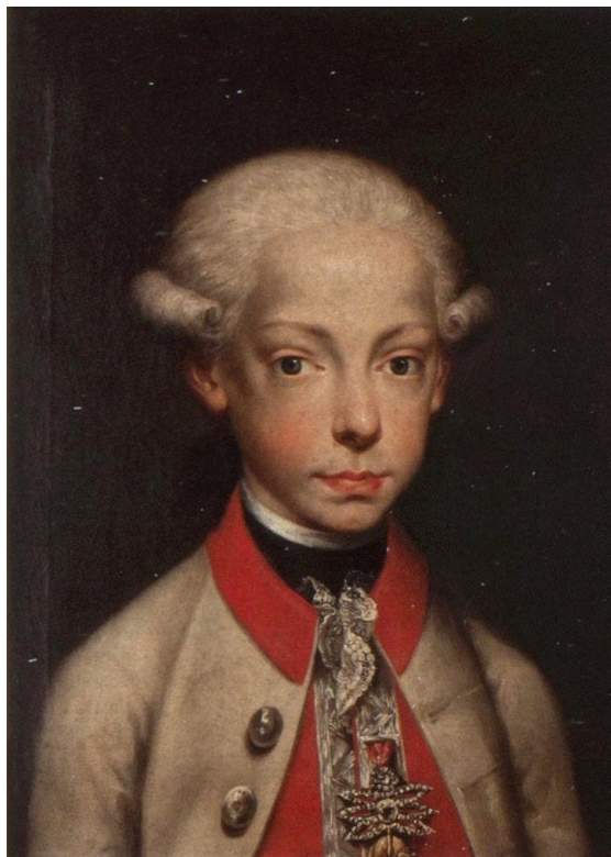
G. A. Fabbrini, Ritratto di Ferdinando III futuro granduca di Toscana , 1780 ca., disegno, Firenze, Gabinetto Disegni e Stampe degli Uffizi.