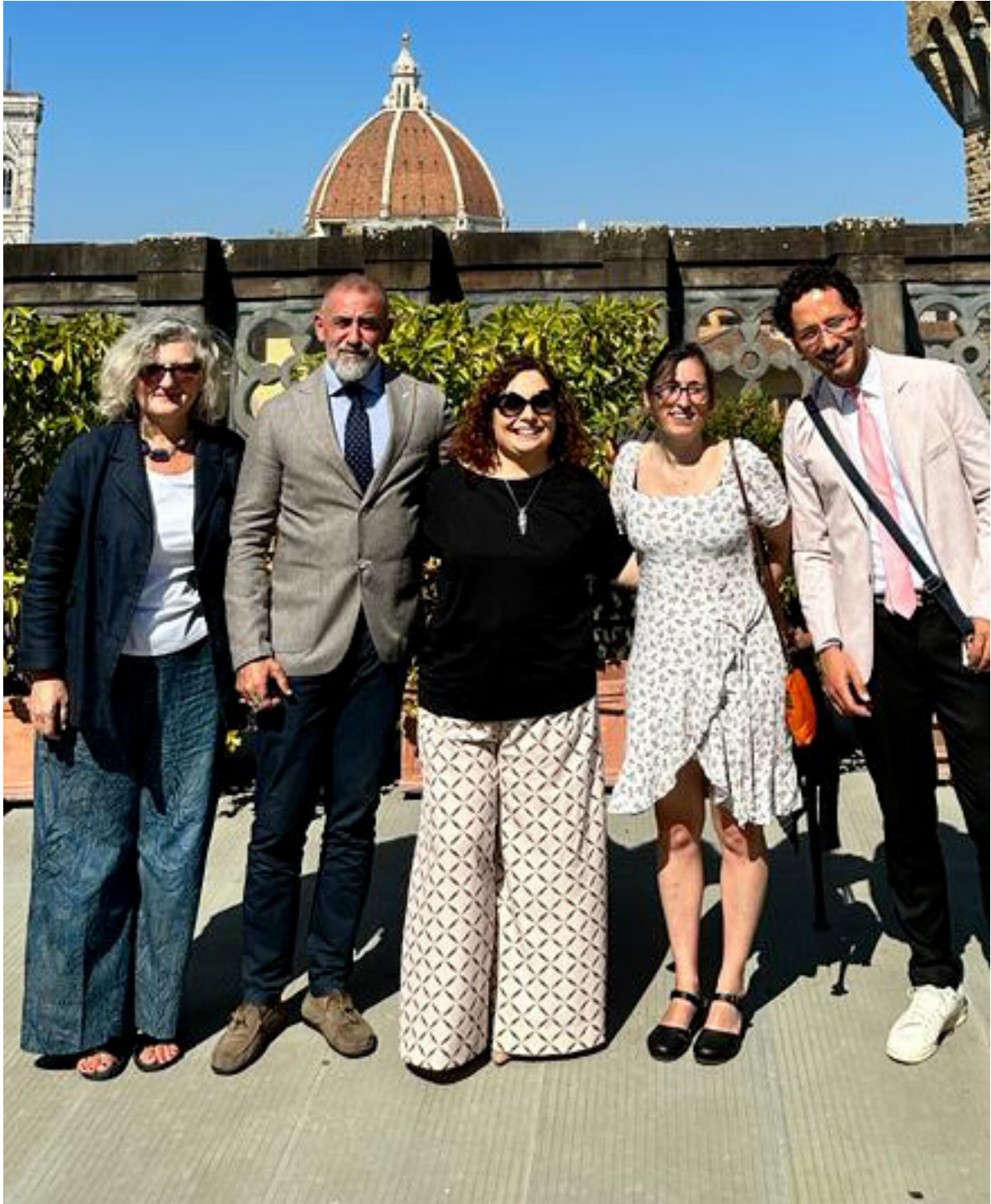
I relatori intervenuti alla Giornata di Studi "Pecunia non olet. I banchieri di Roma Antica" (Gli Uffizi, 8 settembre 2023)