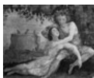
Mannozi Giovanni detto Giovanni da San Giovanni Bacco e Arianna 1890, n. 5428