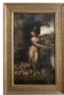
Melzi Francesco, attribuito a Leda e il cigno 1890, n. 9953

Mostra: Perugia - Galleria Nazionale dell'Umbria,