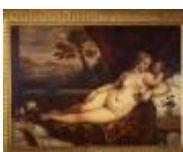
Vecellio Tiziano, attribuito a Venere e Amore con un cane e una pernice 1890, n. 1431

Mostra: Genova, Palazzo Ducale, Appartamento del Doge, 21 marzo - 19 luglio 2026