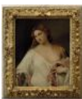
Vecellio Tiziano Flora 1890, n. 1462

Mostra: Pechino, National Art Museum, 18 aprile- 18 luglio 2026