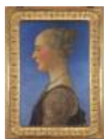
Benci Antonio detto Pollaiuolo Ritratto di donna 1890, n. 1491

Mostra: Pechino, National Art Museum, 18 aprile- 18 luglio 2026