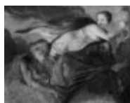
Mannozi Giovanni detto Giovanni da San Giovanni Aurora e il Sonno 1890, n. 5423