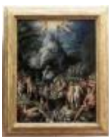
Zucchi Jacopo L'età dell'oro 1890, n. 1548

Mostra: Bruxelles - Bozar - Centre for Fine Arts, 20 febbraio - 14 giugno 2026