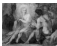
Mannozi Giovanni detto Giovanni da San Giovanni Apollo e Marsia 1890, n. 5429

Mostra: Pechino, National Art Museum, 18 aprile- 18 luglio 2026