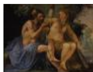
Mannozi Giovanni detto Giovanni da San Giovanni Ercole e Onfale 1890, n. 5414