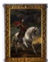
Van Dyck Antonie Ritratto di Carlo V a cavallo 1890, n. 1439

Mostra: Pechino, National Art Museum, 18 aprile- 18 luglio 2026