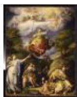
Zucchi Jacopo L'età dell'argento 1890, n. 1506

Mostra: Pechino, National Art Museum, 18 aprile- 18 luglio 2026