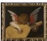
Giovanni Battista di Jacopo detto Rosso Fiorentino Angelo musicante 1890, n. 1505

Mostra: Pechino, National Art Museum, 18 aprile- 18 luglio 2026