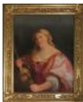
Palma Jacopo de Antonio de Negroto detto Palma il Vecchio Giuditta 1890, n. 939

Mostra: Pechino, National Art Museum, 18 aprile- 18 luglio 2026