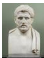
Ritratto di atleta c.d. Alcibiade Sculture (1914), n. 370

Mostra: Firenze, Gli Uffizi, Galleria delle Statue e delle Pitture, Sale del Pianterreno, 28 maggio - 28 novembre 2025 (prorogata fino al 12.04.2026)