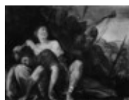
Mannozi Giovanni detto Giovanni da San Giovanni Sansone e Dalila 1890, n. 5424