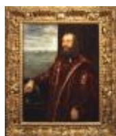
Robusti Jacopo detto Tintoretto Ritratto d'ammiraglio veneziano 1890, n. 921

Mostra: Pechino, National Art Museum, 18 aprile- 18 luglio 2026