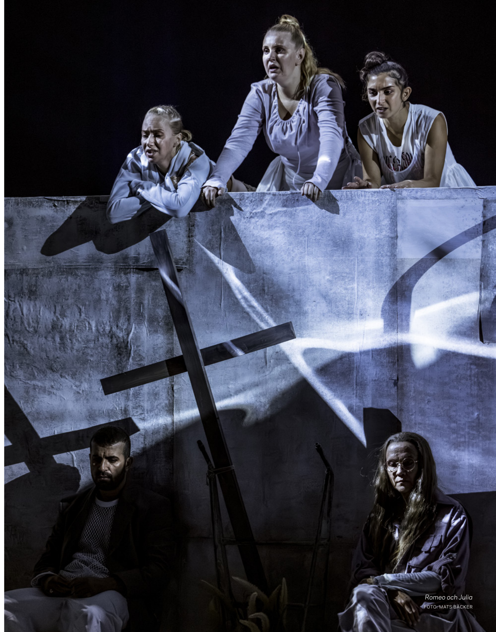
Romeo och Julia