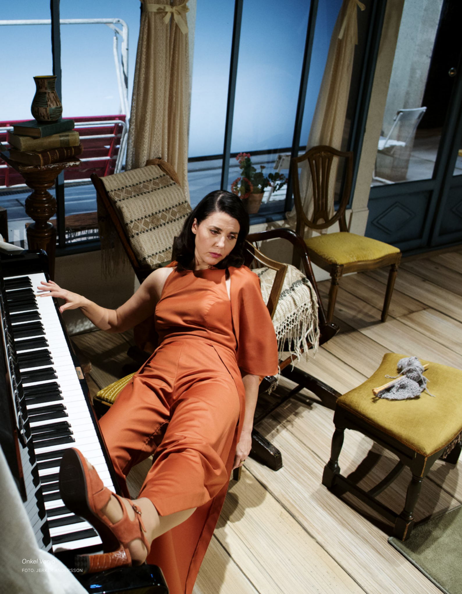
Onkel Vanja

"Ett stort TACK och blommor i mängder till samtliga medverkande som var enastående bra i sina roller! En föreställning som hade allt man kan önska! Snygg scenografi dessutom! Rekommenderas varmt!"