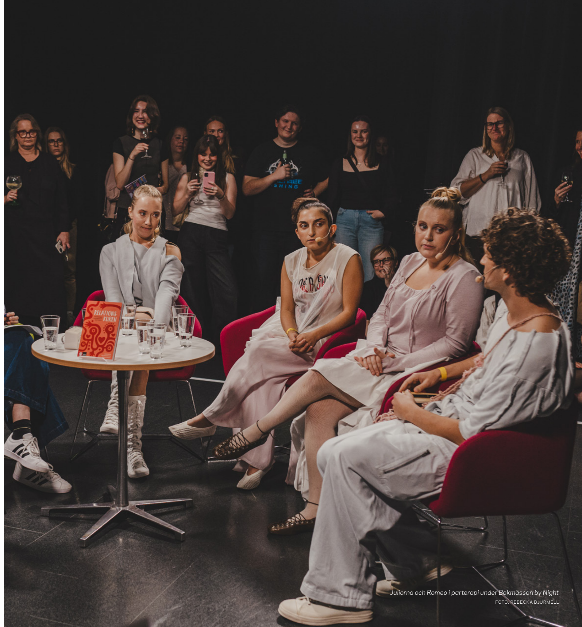
Juliorna och Romeo i parterapi under Bokmässan by Night