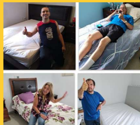
Résidents des Maisons Martin-Matte

Merci de tout cœur pour ce beau geste qui apporte du bonheur et du confort à nos résidents!