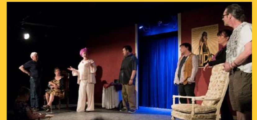
Troupe de théâtre « Les En-Tête-T »