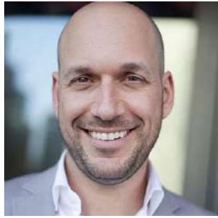
Martin Matte Fondateur et porte-parole Humoriste, acteur, auteur, scénariste et producteur