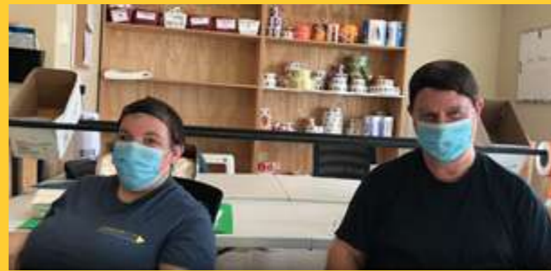
Ateliers de travail