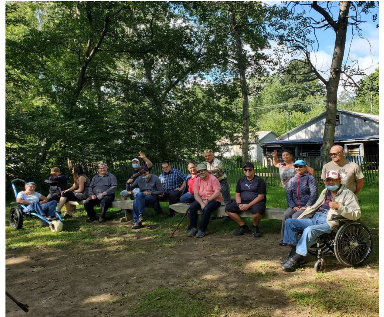
Répit – Association des traumatisés cranio-cérébraux de la Montérégie

Cette année encore, malgré le contexte, il était essentiel de maintenir le lien avec les personnes qui bénéficient d'activités de répit depuis de nombreuses années. En effet, l'impact de la pandémie dans la vie des personnes TCC a été majeur, créant beaucoup d'anxiété et de l'incompréhension en raison de leurs troubles cognitifs. Heureusement, nos organismes partenaires ont continué d'adapter leurs services afin de rester en contact avec leurs membres et de les appuyer. Ces activités de répit sont essentielles, car elles permettent aux personnes TCC de retrouver une certaine autonomie et surtout de briser l'isolement social, tout en offrant une pause aux proches. Grâce à ce soutien offert à l'échelle de la province, la Fondation a contribué à diminuer l'épuisement de milliers de familles et à assurer le maintien à domicile de leur proche.