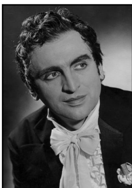
Alfréd ( La traviata , 1959)