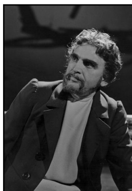
Tichon ( Káťa Kabanová , 1974)