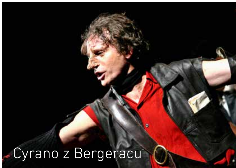
Cyrano z Bergeracu