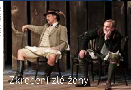
Zkročení zlé ženy