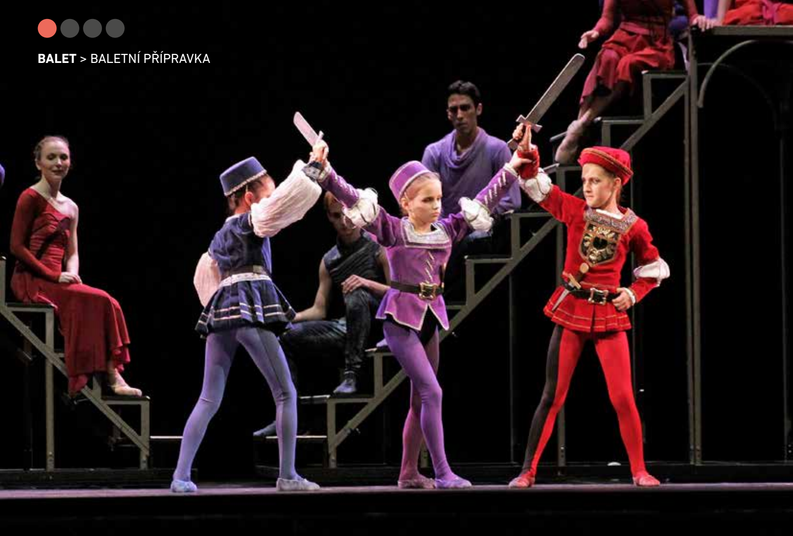
Romeo a Julie