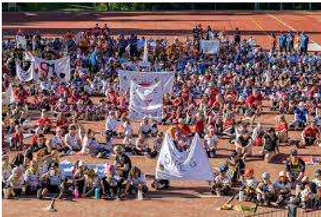
Leirin aikana saamme kokoontua seuraamaan Superpesis-ottelua.

Tulemme lähettämään seuraavan leirikirjeen toukokuussa, jolloin saatte tarkempia tietoja leirille saapumisesta, majoitukseen ja ruokailuihin liittyvistä asioista sekä turvallisuudesta leirillä.