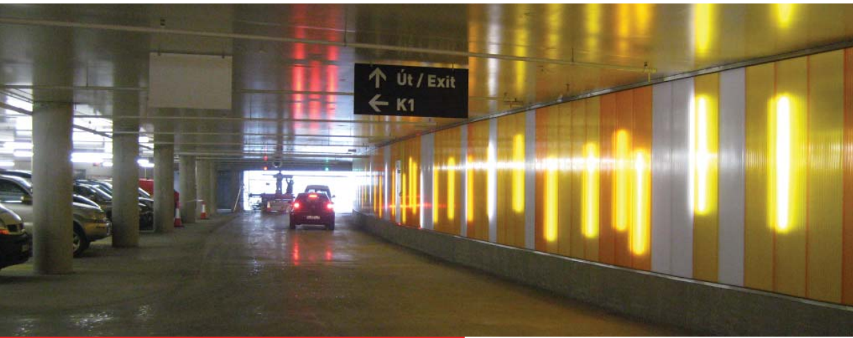
Harpa - Bílastæðahús