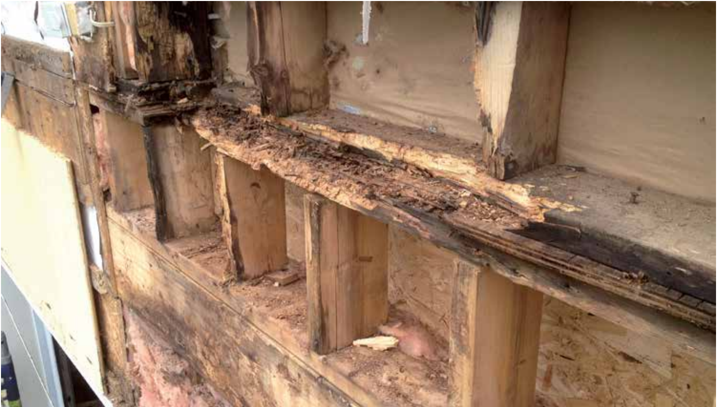
Structure du bâtiment endommagée à l'endroit où était fixée la terrasse.