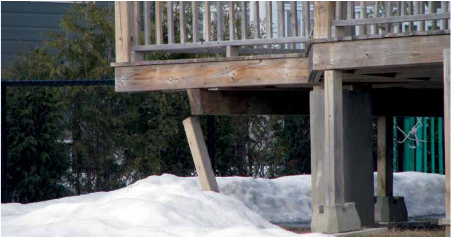
Terrasse s'appuyant sur des « pattes d'éléphant » déposées sur des plaques de béton que le gel a déplacées.