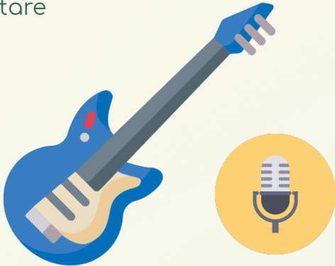
Guitare + Chant Lead