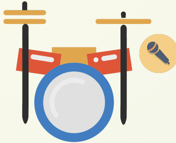
Batterie + Chant