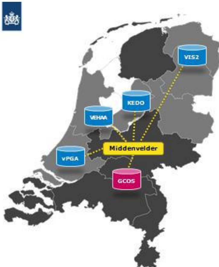
Figuur 1: Werking Middenvelder

De Middenvelder faciliteert samenwerking tussen de verschillende ZVH's, door te voorzien in gestandaardiseerd berichtenverkeer via een verbinding tussen de diverse casusoverlegsysteem van de ZVH's, zoals afgebeeld in figuur 1 en uitgewerkt in tabel 1.