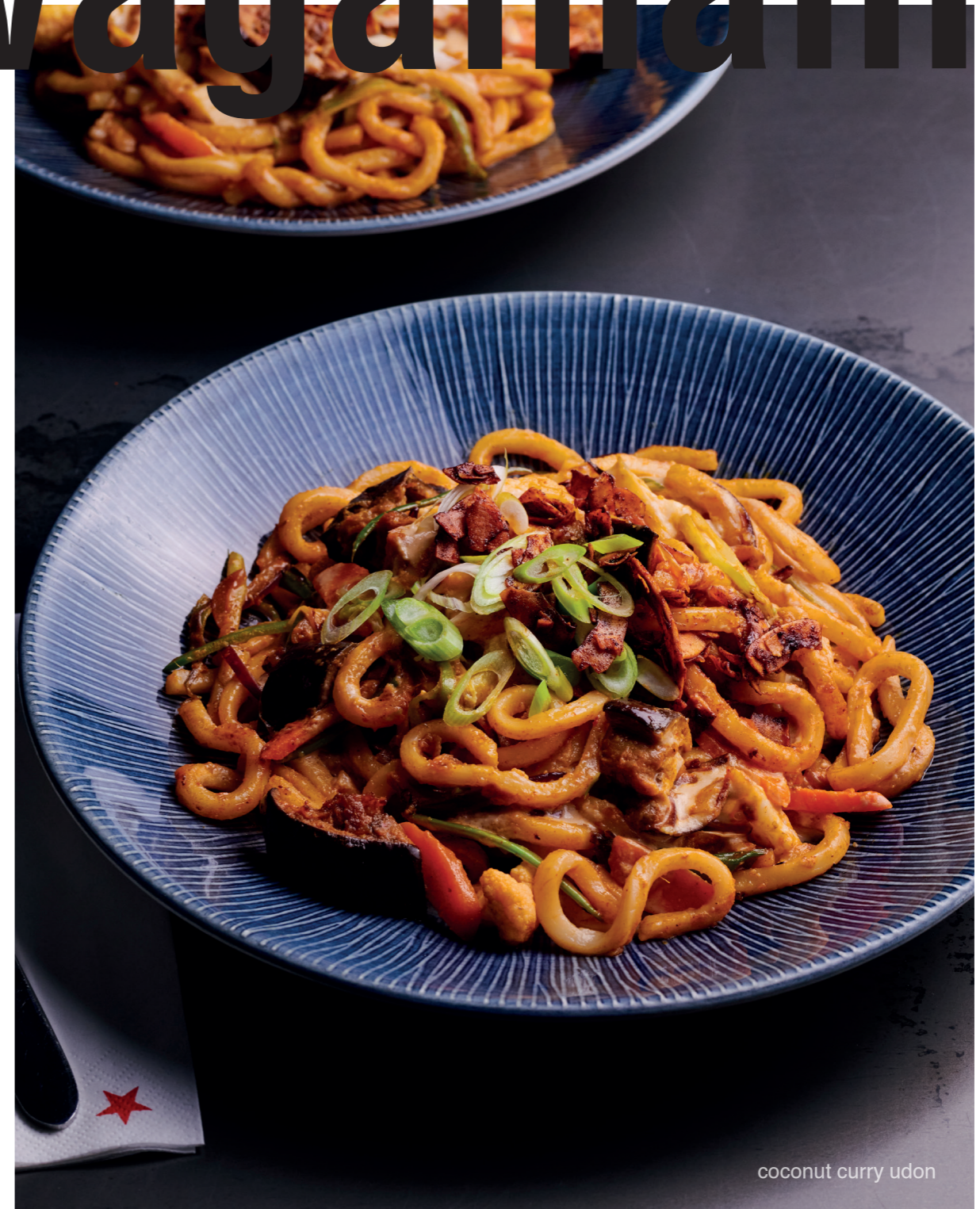
coconut curry udon