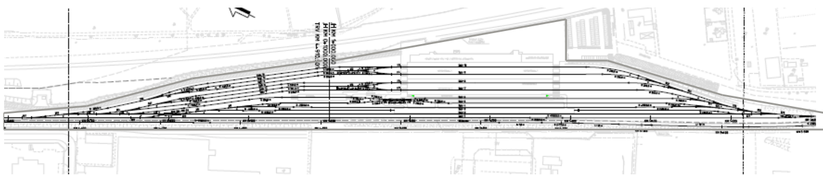
Fig. Samordningsområde Raus depå.

Området innanför den tjockare markeringen ingår i samordningsområdet.