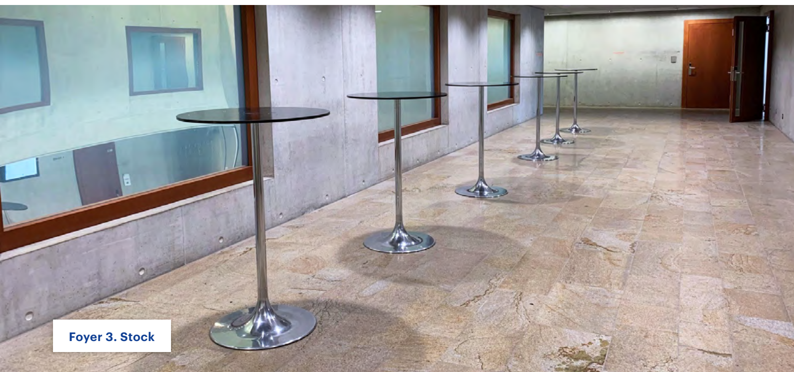
Foyer 3. Stock