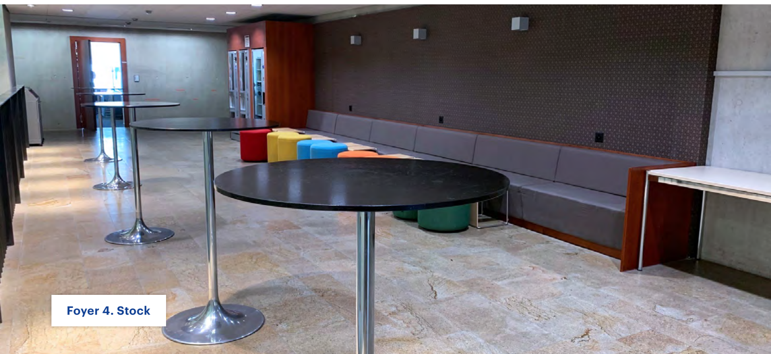
Foyer 4. Stock