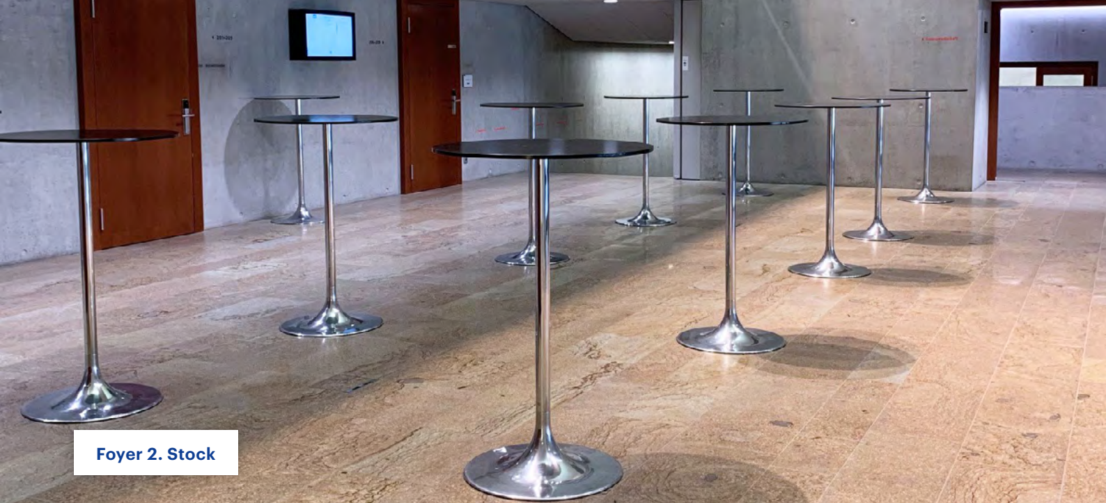
Foyer 2. Stock