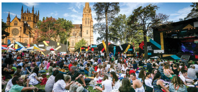
Festival de Sídney, del 7 al 26 de enero sydneyfestival.org.au

Sídney es el lugar indicado para pasar el verano y la Víspera de Fin de Año es solo una noche que forma parte de una temporada con gran variedad de eventos.