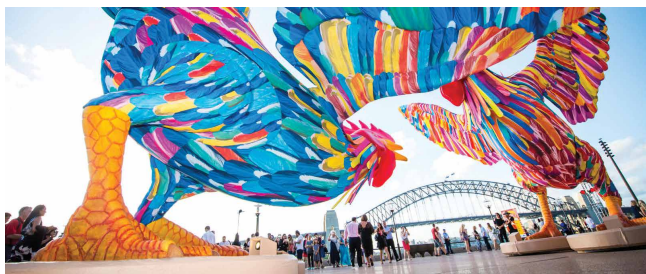
Festival del Año Nuevo Chino de Sídney 2018 Del 16 de febrero al 4 de marzo sydneychinesenewyear.com