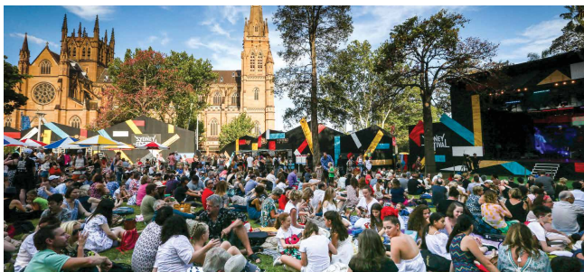
悉尼艺术节：1月7日至26日 sydneyfestival.org.au

夏季是到访悉尼的最佳时节，夏季的悉尼精彩纷呈、好戏连台，而跨年庆典只是这缤纷节庆季多样活动中的其中一颗明珠。