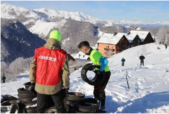
LE MINI GOMME

studiate bene il percorso che è tracciato perché dovete farlo fare agli atleti