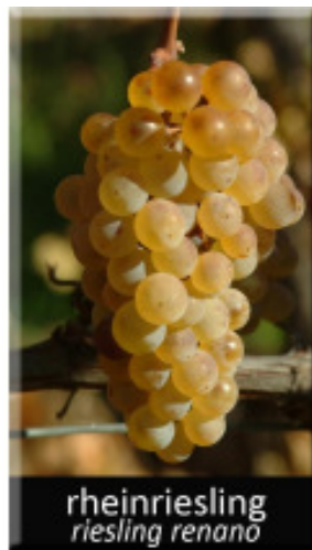
rheinriesling riesling renano

Sulla base di queste riflessioni e in relazione alle caratteristiche che legano la Valle di Cembra - che qualcuno chiama scherzosamente Cembratal - alle zone vinicole tedesche alcuni produttori-pionieri hanno deciso di specializzarsi nella coltivazione di uve considerate particolarmente adatte: