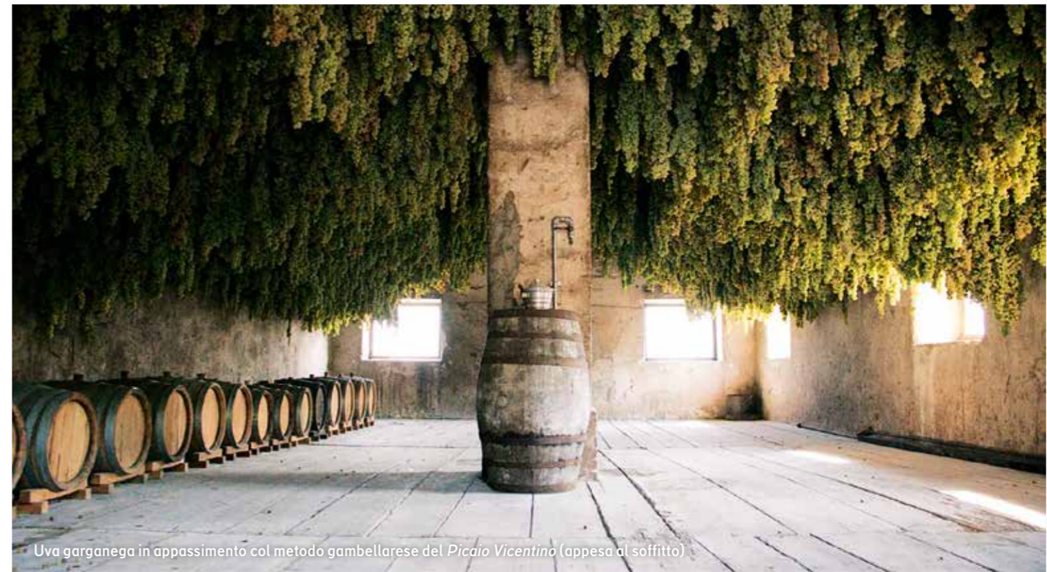
Uva garganega in appassimento col metodo gambellarese del Picaio Vicentino (appesa al soffitto)