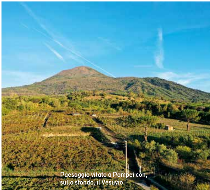
Paesaggio vitato a Pompei con, sullo sfondo, il Vesuvio