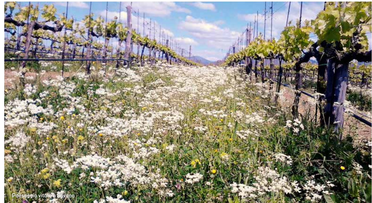
Paesaggio vitato a Sovana