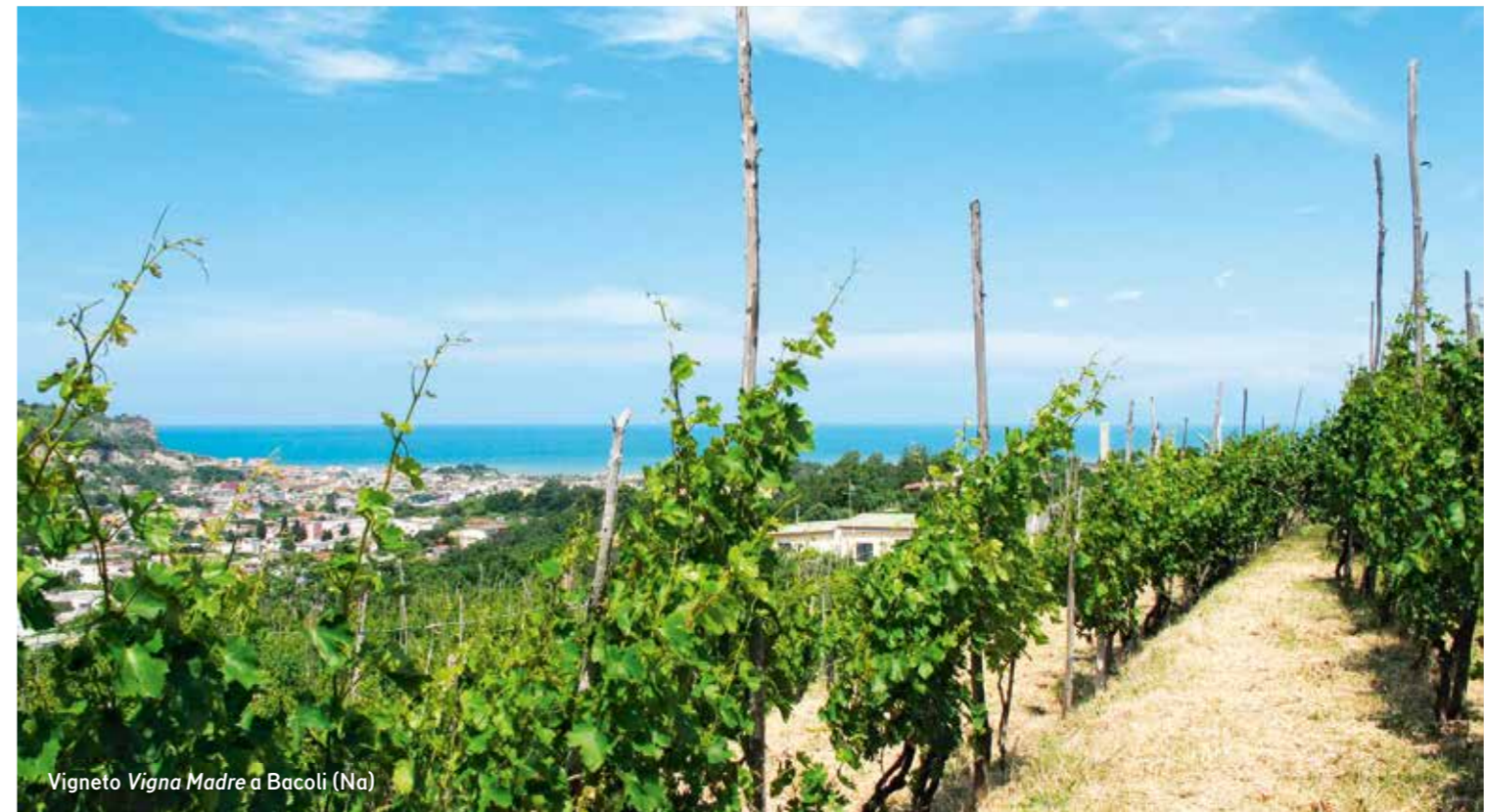
Vigneto Vigna Madre a Bacoli (Na)