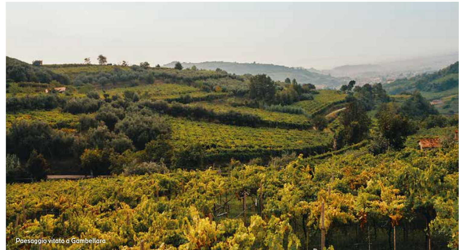
Paesaggio vitato a Gambellara