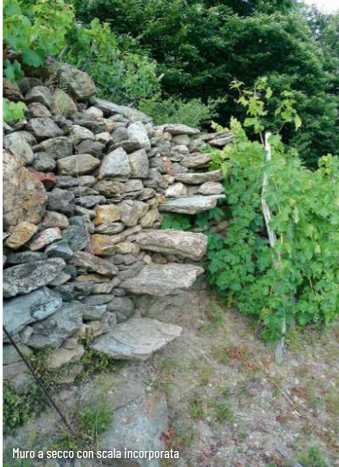
Muro a secco con scala incorporata

I nostri due vitigni a bacca rossa Avanà e Becuet esprimono al meglio le caratteristiche di questo territorio. Sono due varietà "condivise" con la vicina Savoia Francese; un tempo, fino al 1814, la Valle di Susa era sotto il comando francese e, insieme alla Savoia e ad altri dipartimenti, costituiva il Delfinato. Questa "regione" si estendeva dal Rodano alla Valle di Susa ed è molto probabilmente questo il motivo che le nostre varietà di uva