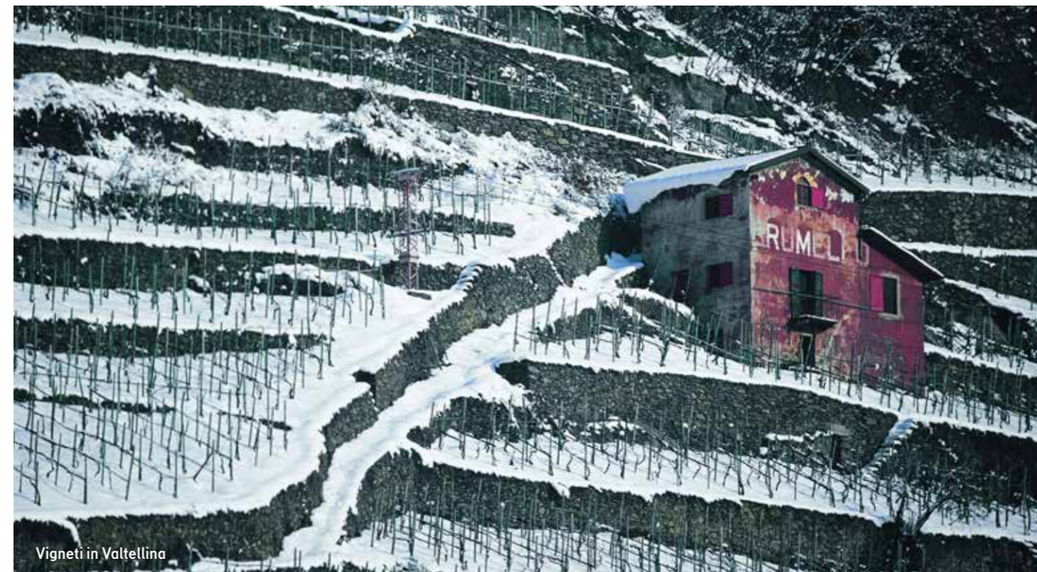
Vigneti in Valtellina