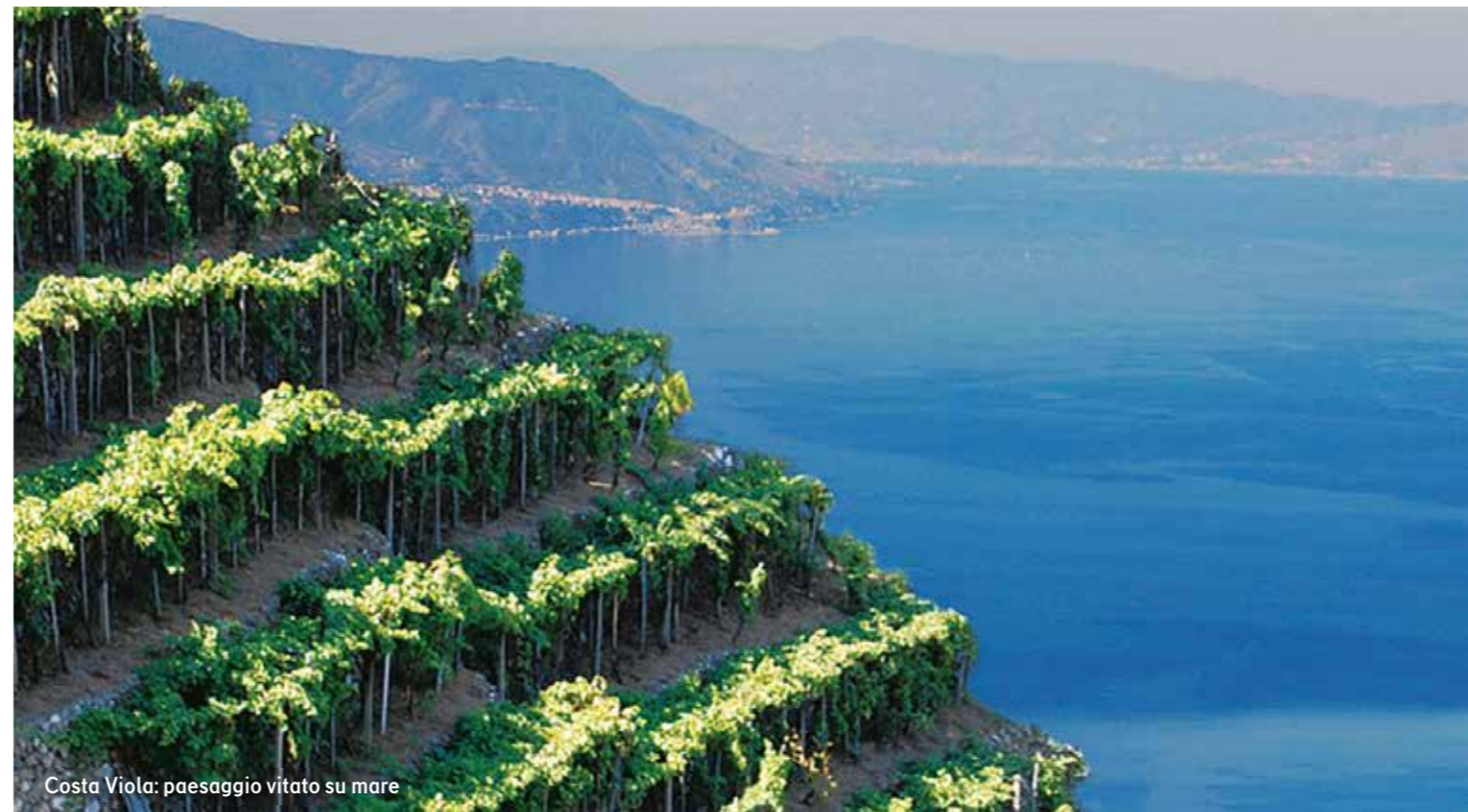
Costa Viola: paesaggio vitato su mare