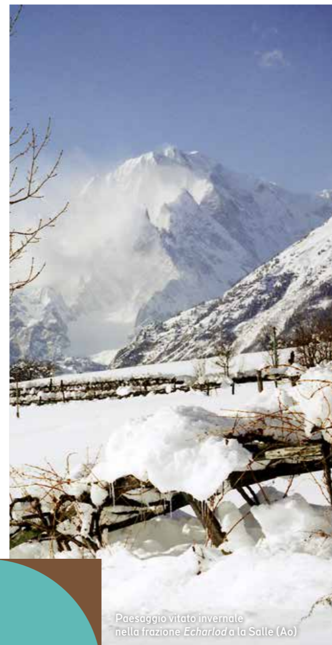
Paesaggio vitato invernale nella frazione Echarlod a la Salle (Ao)