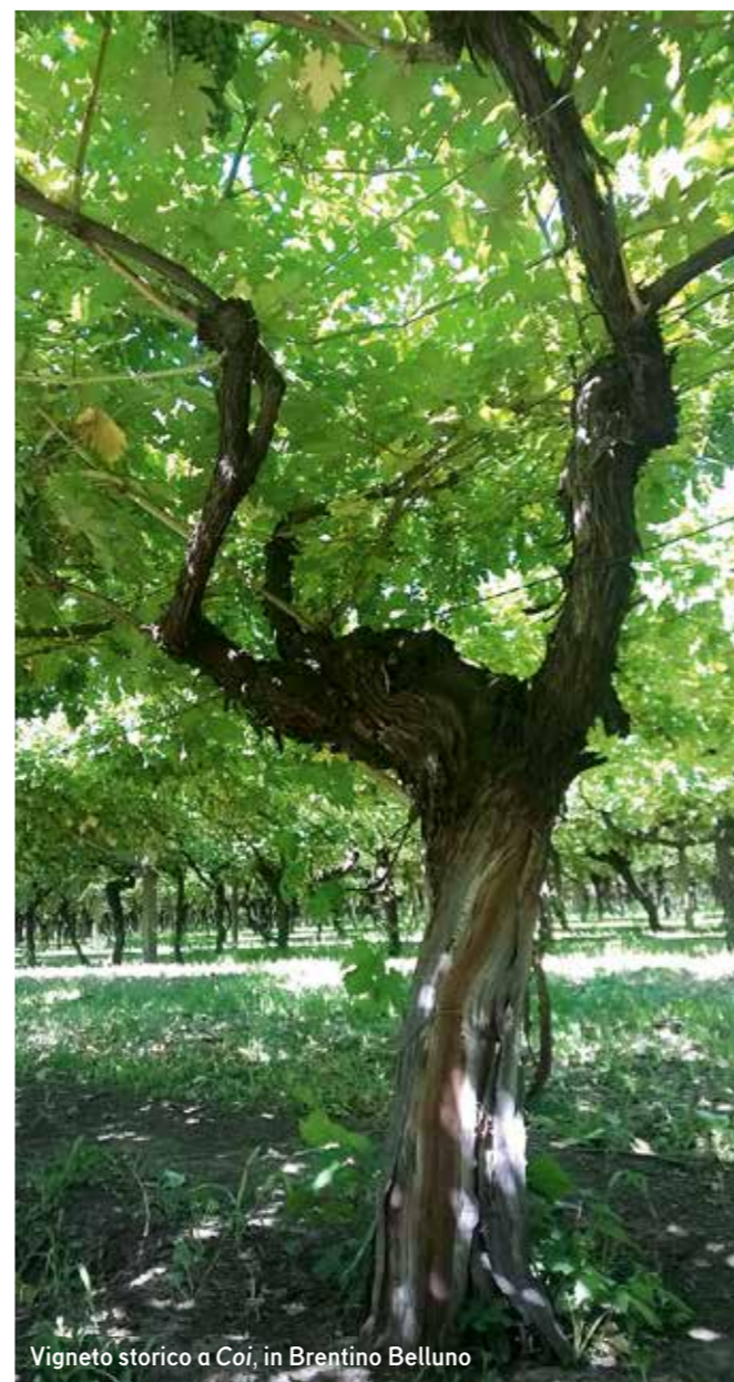
Vigneto storico a Coi, in Brentino Belluno