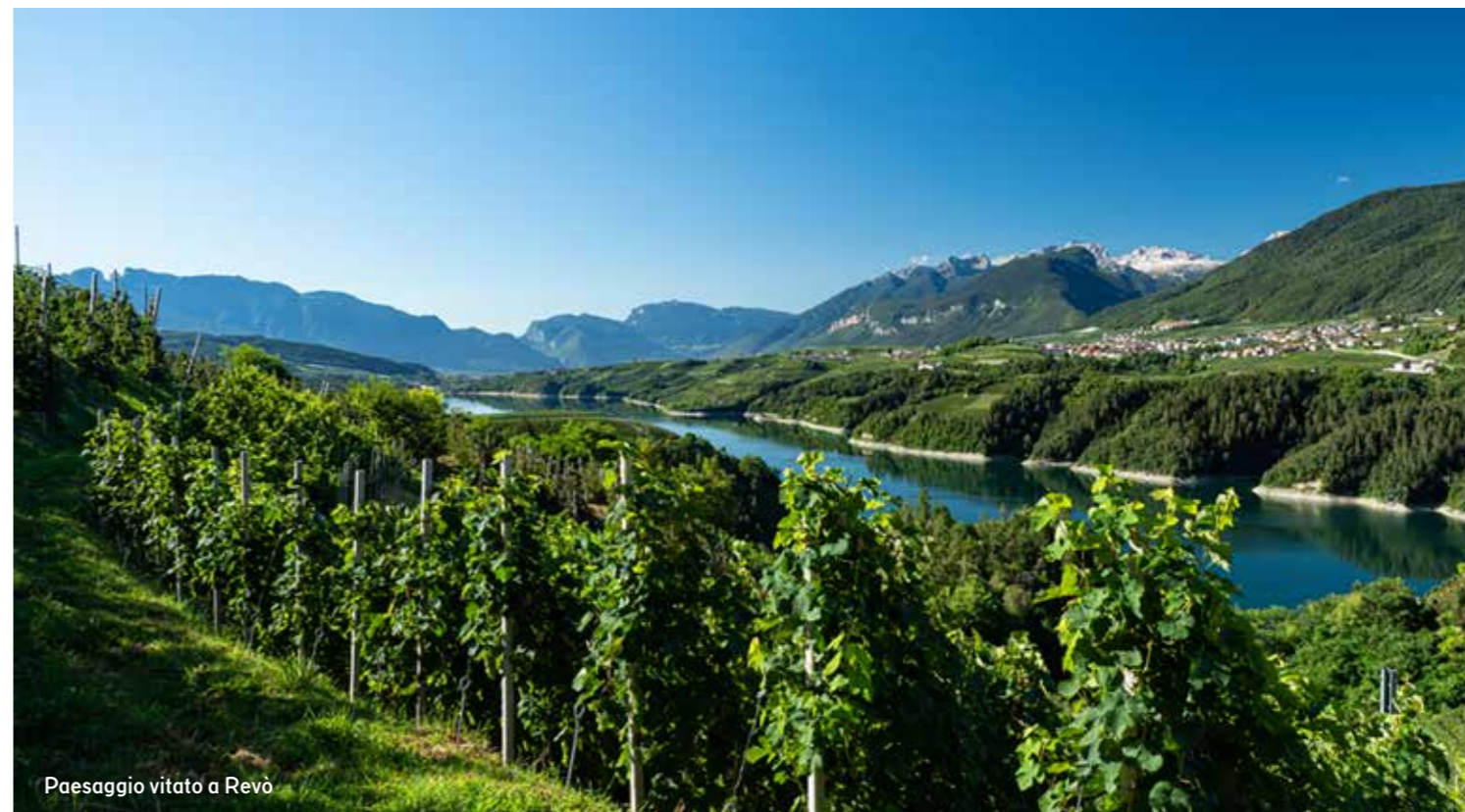
Paesaggio vitato a Revò