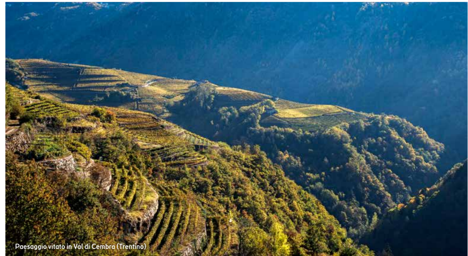
Paesaggio vitato in Val di Cembra (Trentino)