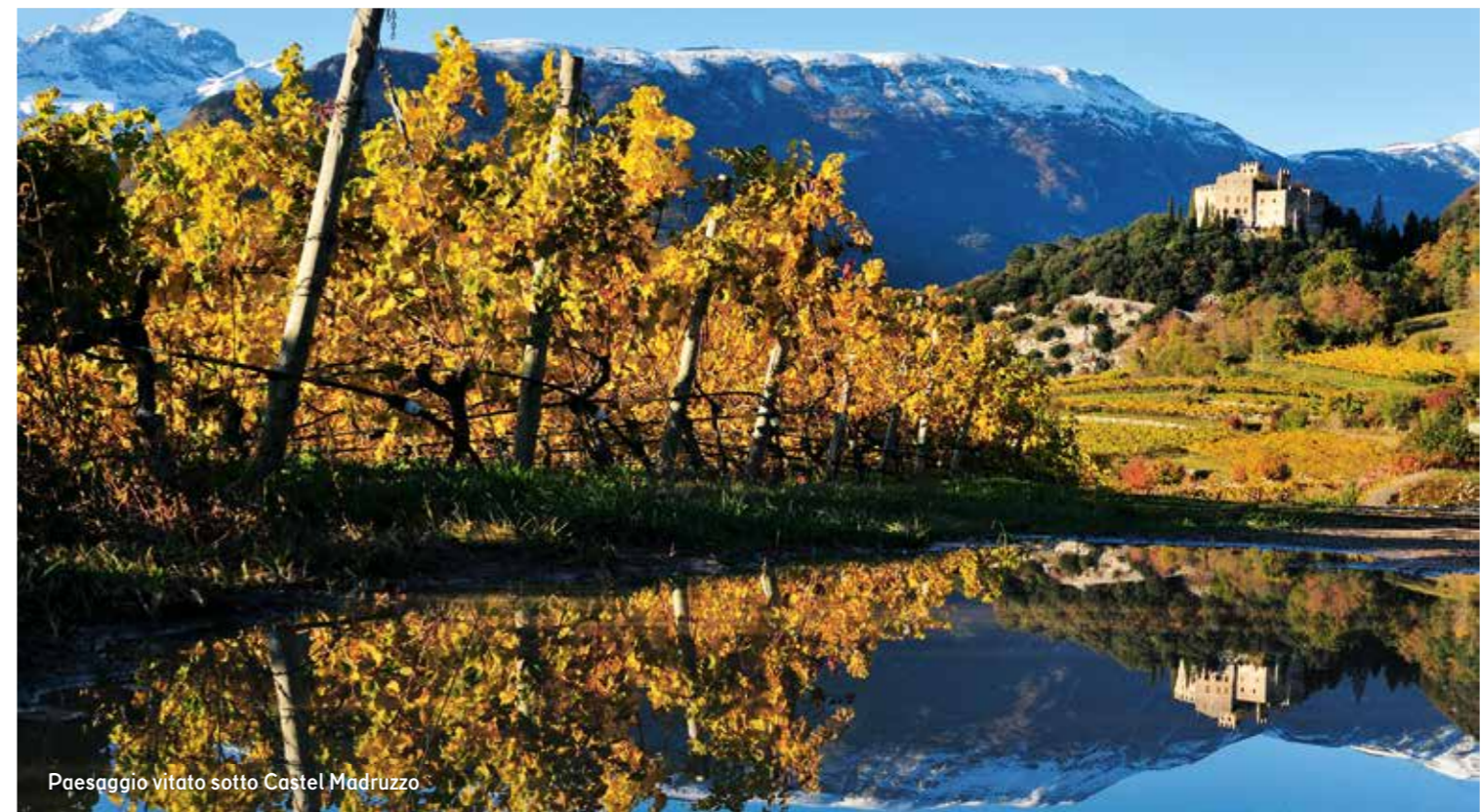
Paesaggio vitato sotto Castel Madruzzo