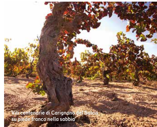
Viti centenarie di Carignano del Sulcis su piede franco nella sabbia