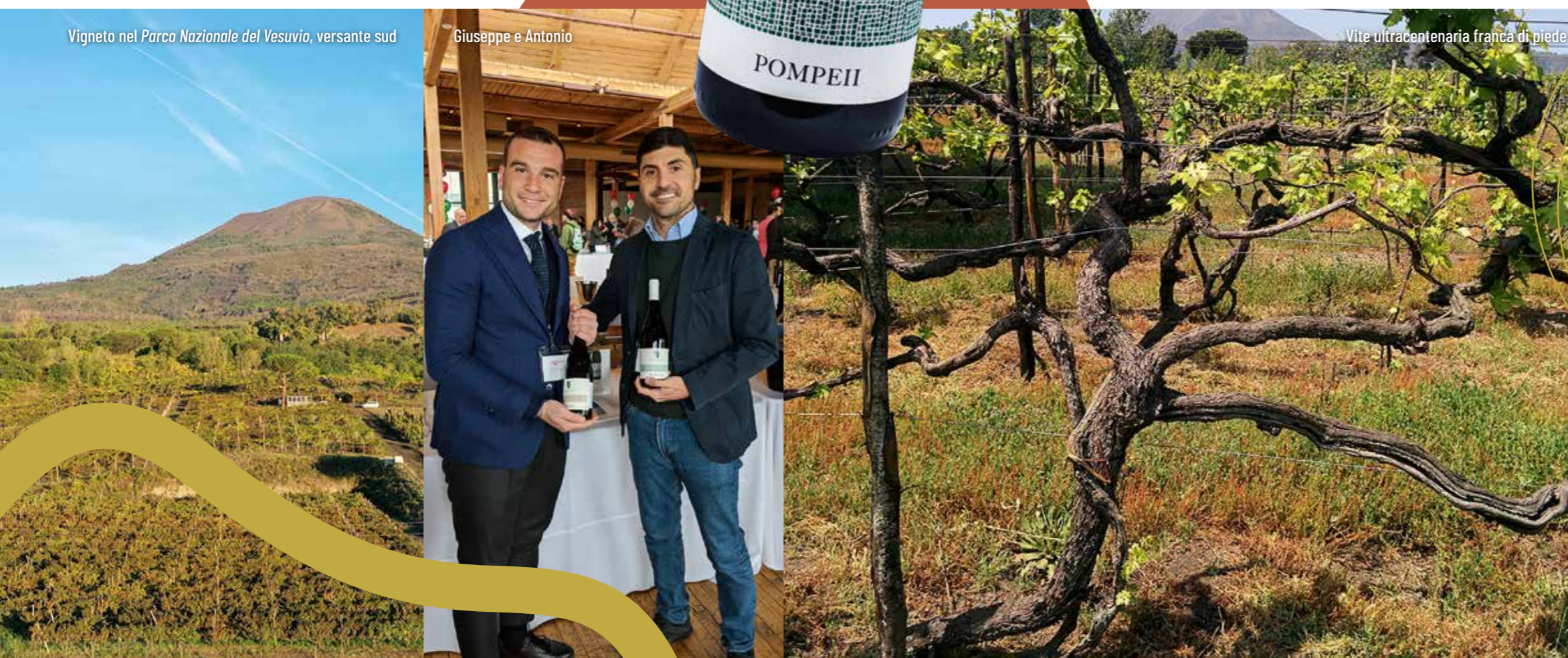
Vite ultracentenaria franca di piede