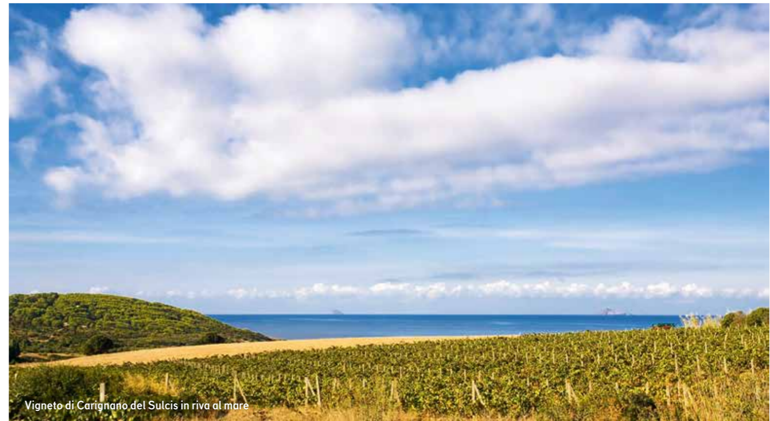
Vigneto di Carignano del Sulcis in riva al mare