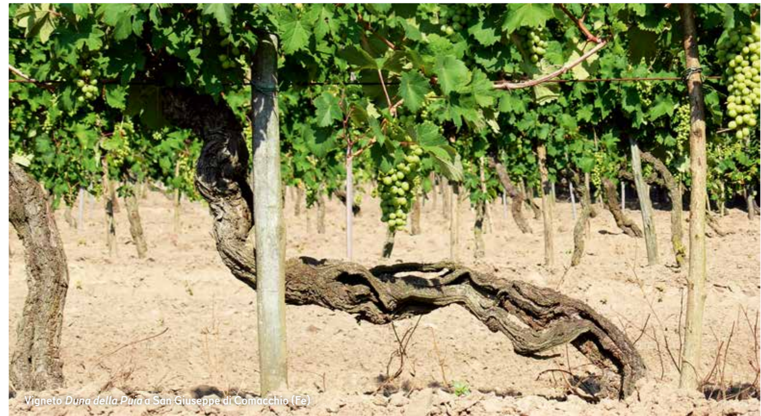
Vigneto Duna della Puia a San Giuseppe di Comacchio (Fe)