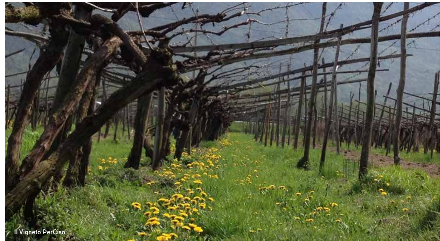
Il Vigneto PerCiso