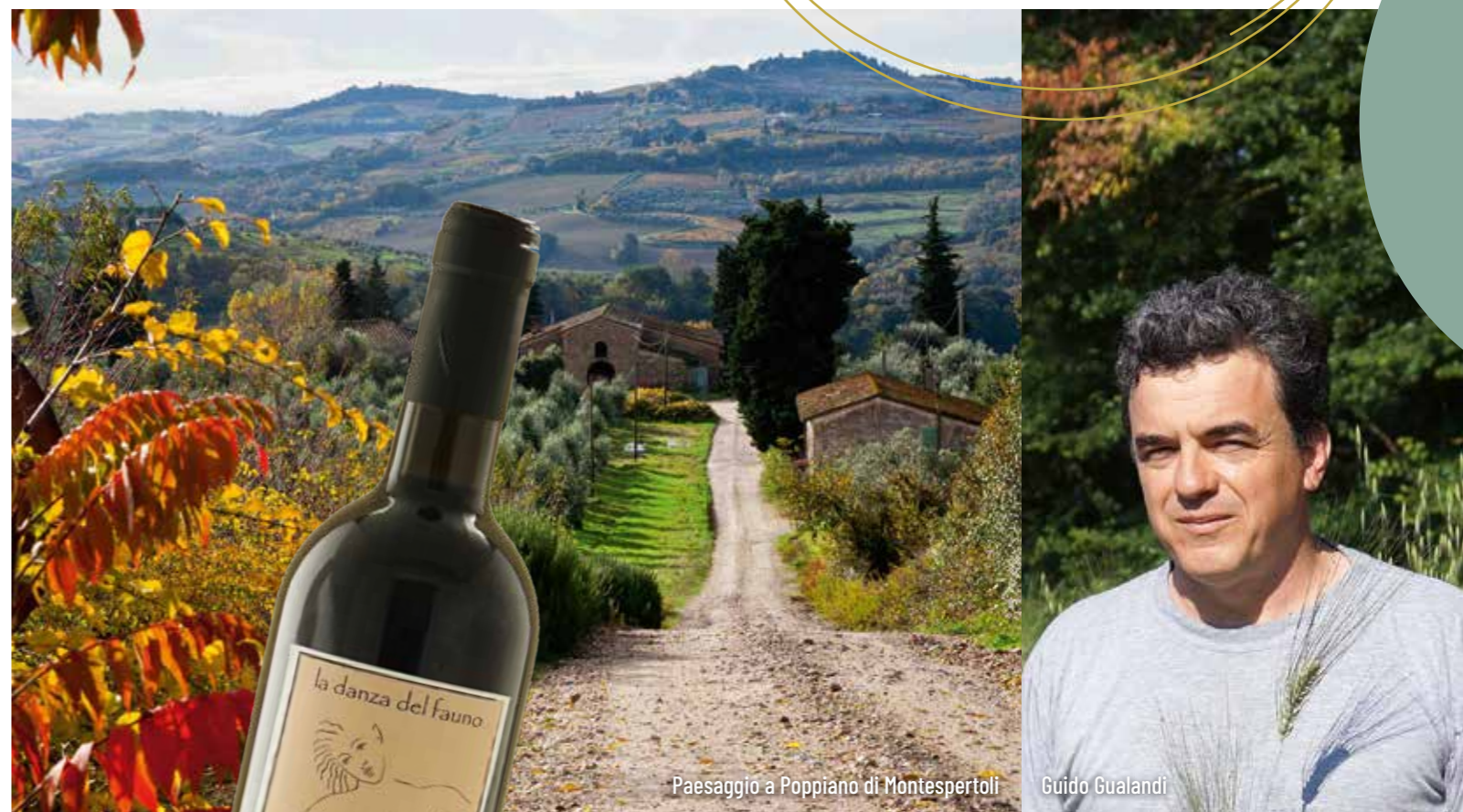
Paesaggio a Poppiano di Montespertoli