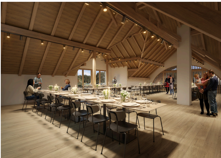
Einblick in den zukünftigen Hofsaal