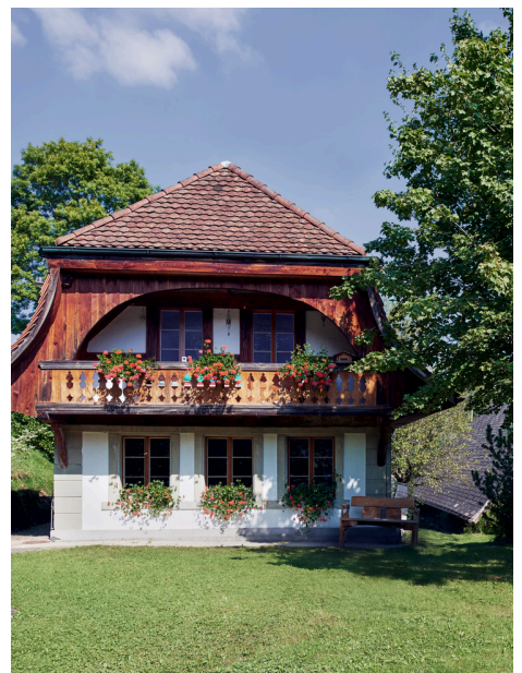
Trauung vor dem Schmittli