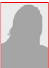
Sidse Frich Thygesen Seniorkonsulent