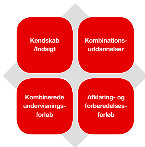
Figur 3. Hovedområder for samarbejde mellem formel uddannelse og ikke-formel læring