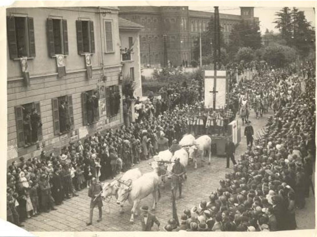
Palio di Legnano, 1938