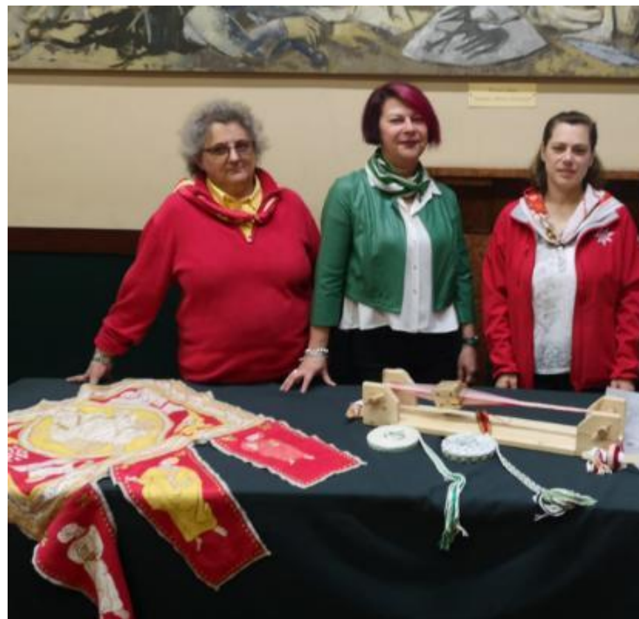
Alcune dame di contrada presentano le ricostruzioni storiche da loro realizzate