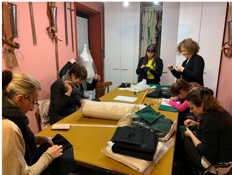
Dame di contrada impegnate nel lavoro sartoriale