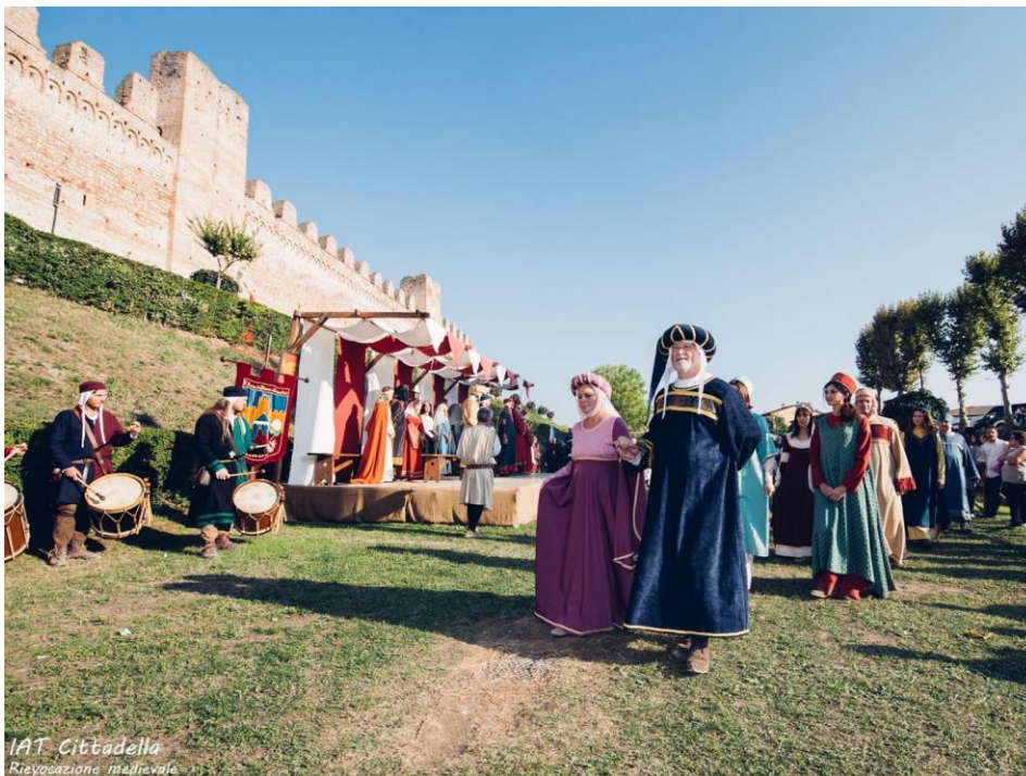
Rievocazione Medievale a Cittadella