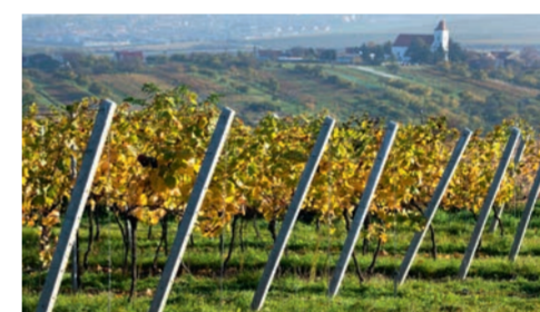
kolonie Pod strážním kopcem na Vrbici se