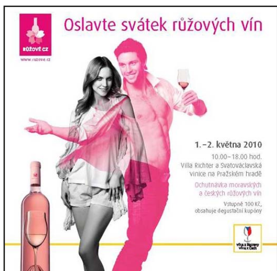
Vizuál projektu Růžové CZ, oficiální logo vlevo nahoře

Součástí projektu Růžové CZ je i gastronomická soutěž pořádaná Asociací kuchařů a cukrářů ČR. Cílem soutěže bylo vytvořit pokrmy vhodné k růžovým vínům s důrazem na dostupnost surovin. Finále soutěže proběhlo 10. dubna v Praze, vítězné pokrmy (předkrm, hlavní chod, dezert) budou představeny 1. května ve Ville Richter, mj. také ve formě „růžové kuchačky.“ Další info hledejte na www.ruzove.cz .