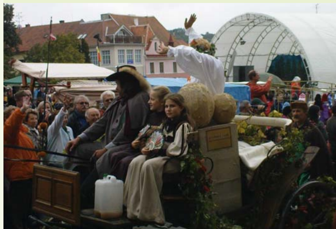
Ve slavnostním průvodu Burčákových slavností nesmí chybět Vinná kvasinka.