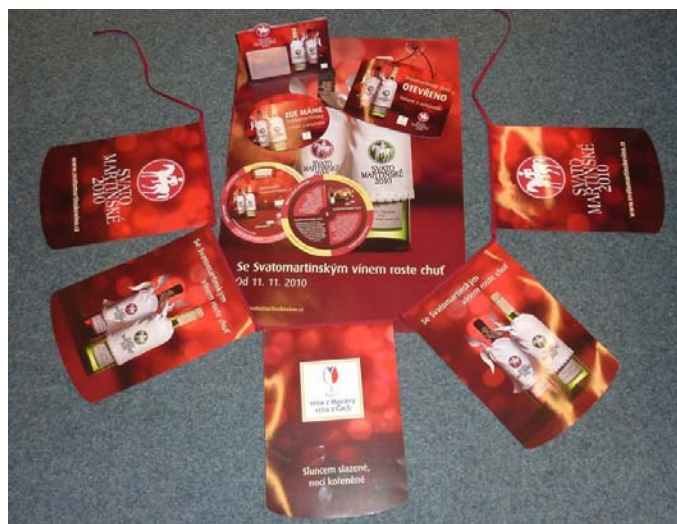
P.O.S. materiály Svatomartinské