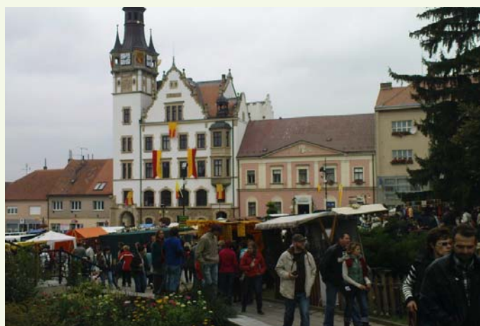
Jedna z posledních akcí oslavujících vinobraní letošního roku proběhla tradičně první říjnový víkend v Hustopečích