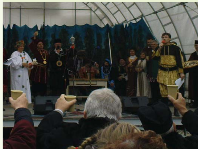
Nedílnou součástí oslav je přijímání nových členů Burčákové Unie