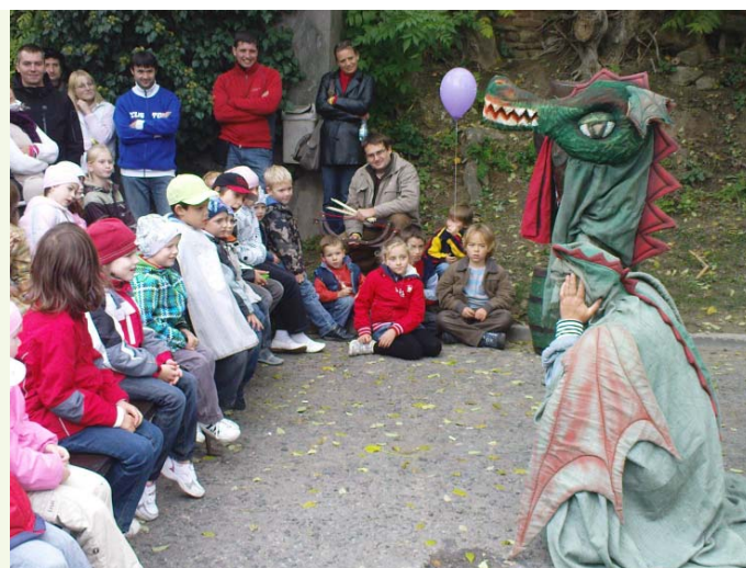
Rodiče si užívali burčáku a vína a děti pohádek...