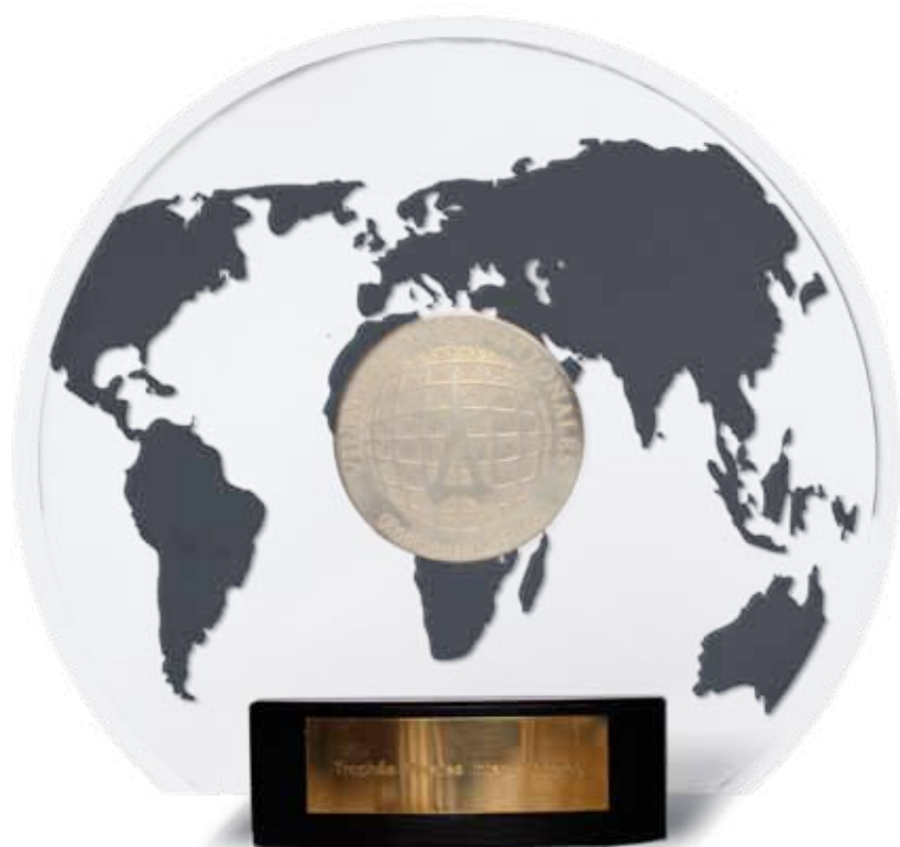
Trophée Vinalies Internationales 2012

Les médailles Vinalies d'or et Vinalies d'argent sont attribuées aux vins appréciés dans le strict respect des règles imposées par les organismes officiels. Récompenses suprêmes, 7 Trophées sont décernés aux vins ayant obtenu la meilleure note dans leur catégorie.