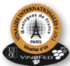
Macarons Vinalies d'or 2012