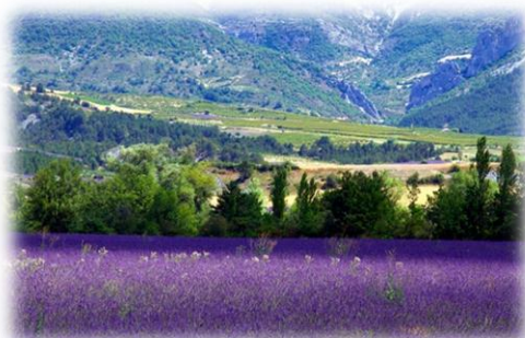
Isle sur la Sorgue (receny provensalske Benatky)