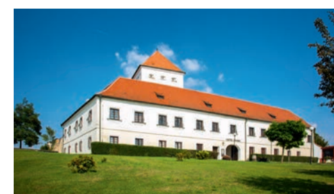
kolonie Pod strážním kopcem na Vrbici se