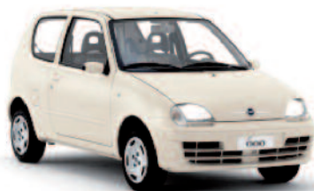
1° Premio Autovettura FIAT 600 (Tuttauto Concessionaria FIAT)