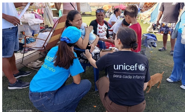
Stato di La Guaira, Venezuela, 28 giugno 2026. La squadra UNICEF in missione nei rifugi dello Stato di La Guaira, per rilevare i bisogni più urgenti delle famiglie colpite, in particolare dei bambini e delle madri. La missione fa parte della risposta d'emergenza dell'UNICEF, per garantire ai bambini l'accesso alle cure sanitarie, ai servizi di protezione, al supporto psicosociale, all'acqua sicura e a spazi sicuri