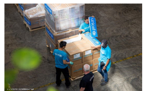
26 giugno 2026, UNICEF Supply Division, Copenhagen. La preparazione per l'invio degli aiuti d'emergenza UNICEF per i bambini bisognosi di assistenza dopo i potenti terremoti del 24 giugno in Venezuela, in allestimento presso la Supply Division dell'UNICEF, il polo globale di fornitura e logistica dell'UNICEF a Copenhagen. Gli aiuti includono scorte mediche di emergenza come kit di primo soccorso e di cura neonatale, compresse per la purificazione dell'acqua e il necessario per lo stoccaggio sicuro dell'acqua, tende per allestire Spazi a misura di bambino e centri d'assistenza per bambini e famiglie