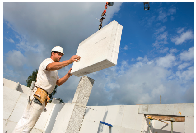
Kalkzandsteenelementen worden in positie getakeld.

Door de relatief lage temperaturen, ongeveer 200 graden Celsius, is er niet heel veel energie nodig om de producten te verharderen.”