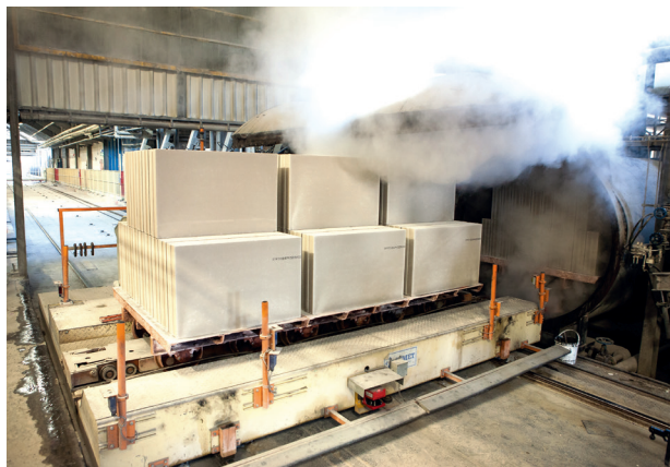
Kalkzandsteenelementen komen net uit de hete autoclaaf.