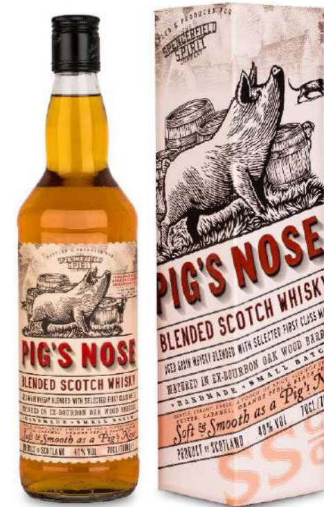
700ml • 14,85€ Oferta Cx Cartão