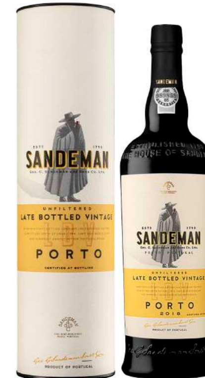
750ml • 16,70€ Oferta Cx Cartão