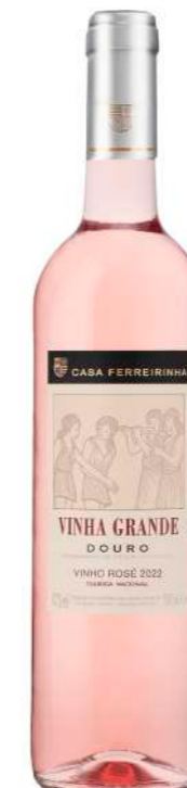
Região • Douro 750ml • 9,75€