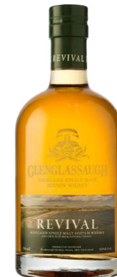
700ml • 33,85€ Oferta Cx Cartão