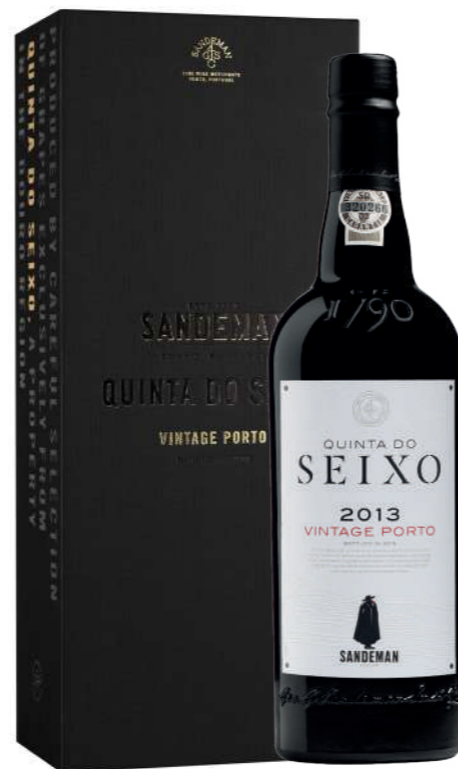
750ml • 52,90€ Oferta Cx Cartão