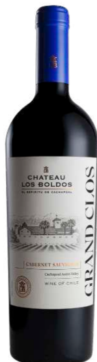
Região • Chile 750ml • 31€