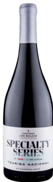
Região • Chile 750ml • 16,40€