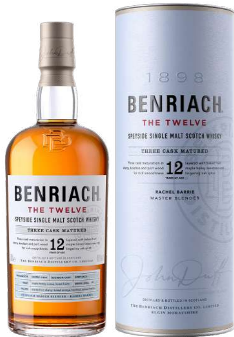
700ml • 48€ Oferta Cx Cartão

Pig's Nose é um blended scotch whisky contemporâneo e desenvolvido a pensar no consumidor atual, com uma imagem diferenciadora e um líquido suave que permite desfrutar das ricas notas de sabor. Resulta da elevada qualidade dos malts (Speyside, Highlands e Lowland), usados no blend, e do processo de envelhecimento, em que se utiliza antigos cascos de bourbon em 1º enchimento.