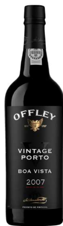
750ml • 30,90€ Oferta Cx Cartão