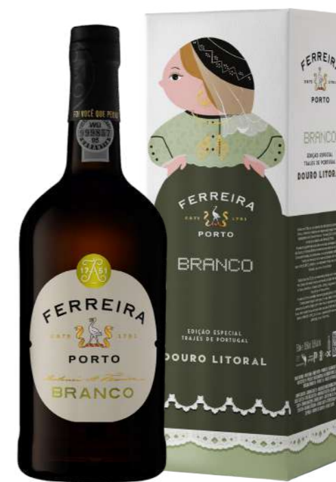
750ml • 5,55€ Oferta Cx Cartão