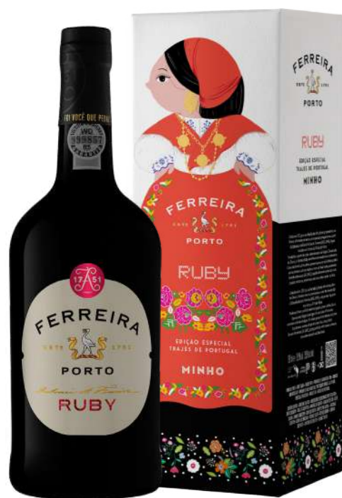
750ml • 5,55€ Oferta Cx Cartão

Ferreira Branco é um Vinho do Porto branco clássico, um vinho atractivo e rico, com o sabor genuíno dos melhores vinhos produzidos na região do Douro com o cuidado e saber acumulado ao longo de mais de 250 anos de excelência que fazem da Ferreira a mais antiga e celebrada marca portuguesa de Vinho do Porto no mundo.