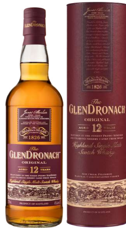
700ml • 41,50€ Oferta Cx Cartão