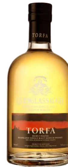
700ml • 38,85€ Oferta Cx Cartão