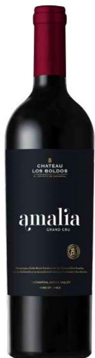
Região • Chile 750ml • 57,55€

As águas do rio Cachapoal que irrigam as nossas vinhas são particularmente ricas em Carbonato de Cálcio. A fruta que produzem é portanto brilhante e expressiva, com boa acidez natural, emprestando-se perfeitamente para a produção de vinhos espumantes. Este é feito num estilo de consumo precoce, com uma dosagem de 7-9 g/l