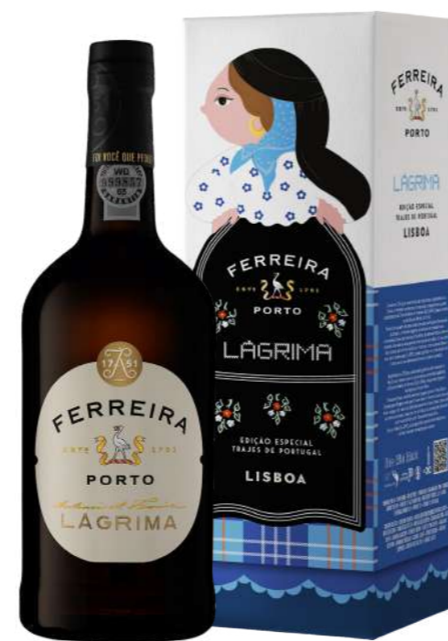
750ml • 6,60€ Oferta Cx Cartão