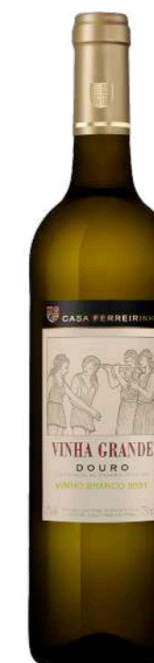
Região • Douro 750ml • 9,75€