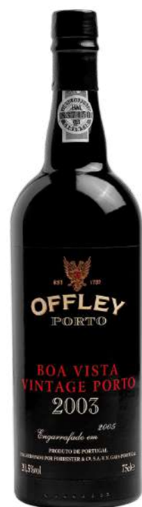
750ml • 30,90€ Oferta Cx Cartão

Offley Late Bottled Vintage é um Vinho do Porto de alta qualidade, de uma única colheita, que é engarrafado entre o 4º e 6º ano após a colheita, podendo ser apreciado de imediato ou após algum envelhecimento em garrafa, consoante a preferência. Este vinho apresenta o estilo muito característico da prestigiada marca Offley, que alia contemporaneidade a quase três séculos de experiência.