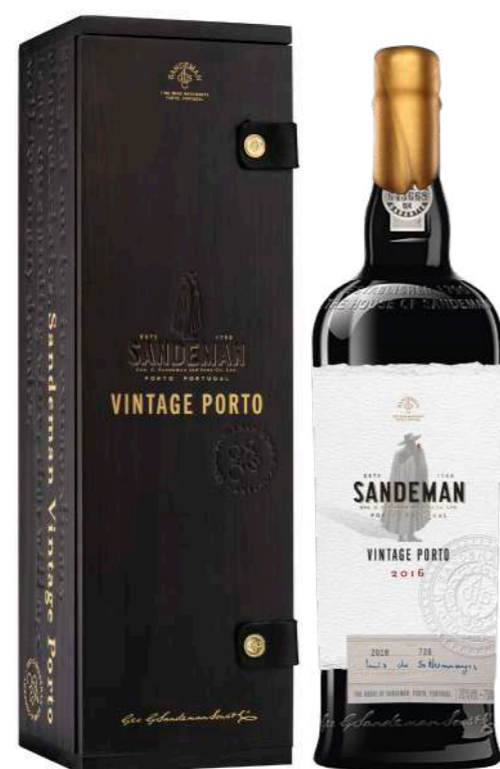
750ml • 61,05€ Oferta Cx Cartão