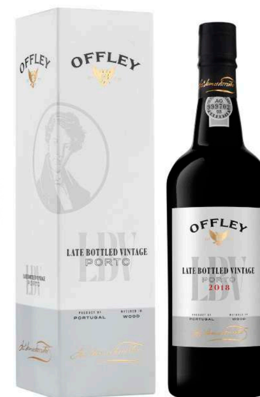
750ml • 16,70€ Oferta Cx Cartão