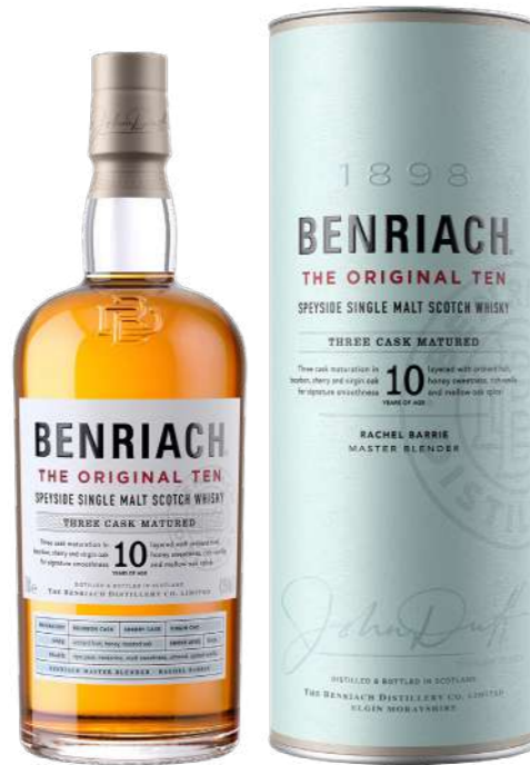
700ml • 33,85€ Oferta Cx Cartão