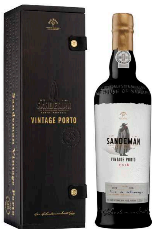
750ml • 77,30€ Oferta Cx Cartão

Os vinhos de alta qualidade da vindima de 2018 foram cuidadosamente selecionados e combinados para criar o Sandeman Porto Late Bottled Vintage 2018. Envelhecido durante cerca de quatro anos, este vinho foi engarrafado sem filtração, mantendo o estilo de um vinho de um só ano.