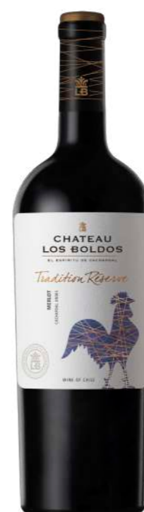
Região • Chile 750ml • 6,05€