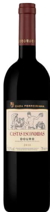
Região • Douro 750ml • 25,70€