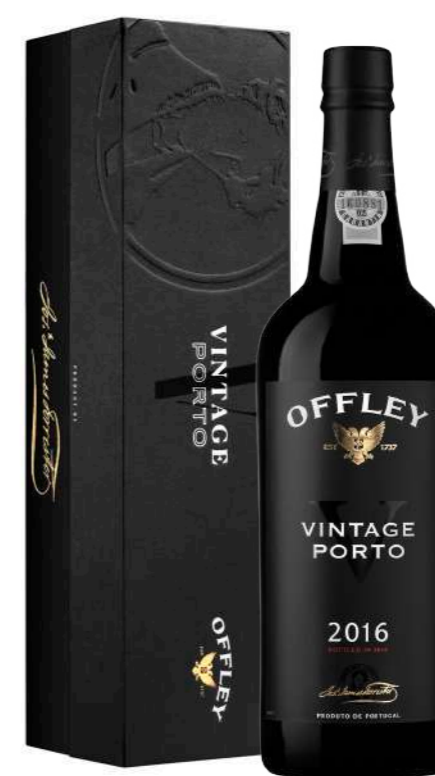
750ml • 48€ Oferta Cx Cartão