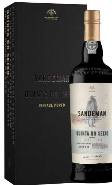
750ml • 55,35€ Oferta Cx Cartão