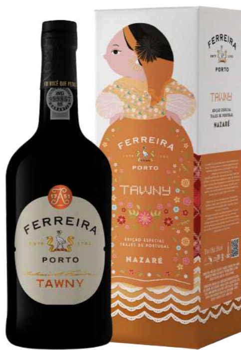
750ml • 5,55€ Oferta Cx Cartão