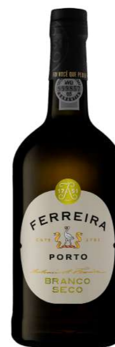
750ml • 5,55€ Oferta Cx Cartão