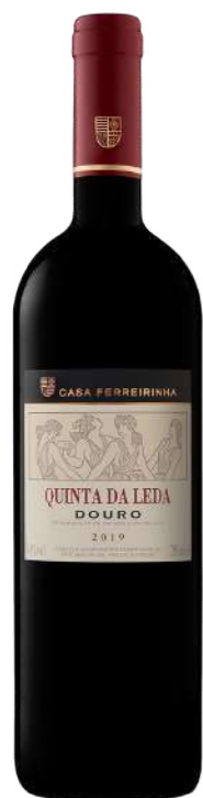
Região • Douro 750ml • 44,25€

Vinha Grande Branco é o primeiro vinho branco da Casa Ferreirinha. Caracteriza-se pela sua intensidade aromática, que o define de forma muito elegante. Vinha Grande Branco revela no seu melhor todo o potencial da região do Douro na produção de vinhos brancos de lote de alta qualidade.