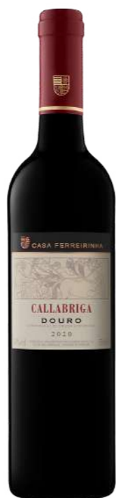
Região • Douro 750ml • 16,40€