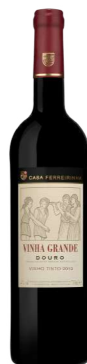
Região • Douro 750ml • 9,75€