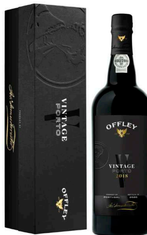
750ml • 48,85€ Oferta Cx Cartão