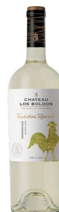
Região • Chile 750ml • 6,05€