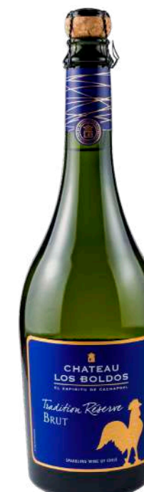
Região • Chile 750ml • 8,05€