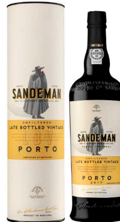
750ml • 16,70€ Oferta Cx Cartão