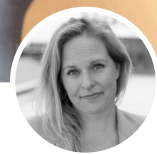
DOOR CHARLOTTE LEEMANS