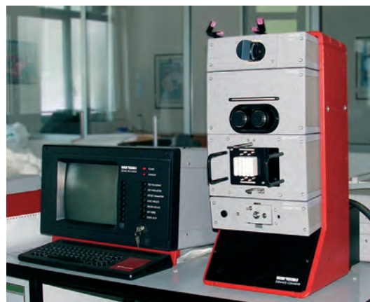
Regularimetro Uster, lo strumento impiegato per la ricerca delle imperfezioni.