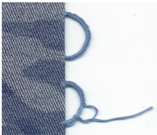
▲ Asole volanti.