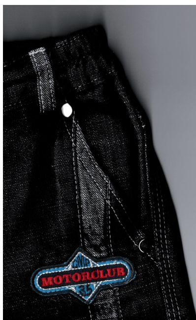
▲ Davanti di pantalone baby con tasca francese.

La silesia è un tipo di fodera realizzata con cotone di buona qualità, caratterizzata da un intreccio a tela o a saia molto serrato e usata prevalentemente per le tasche.