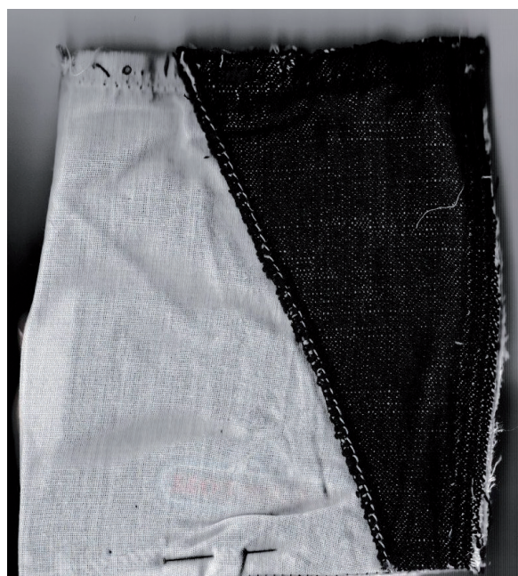
▲ Tasca al rovescio in cui è visibile la fodera della tasca, con parte di controtasca già assemblata alla fodera.