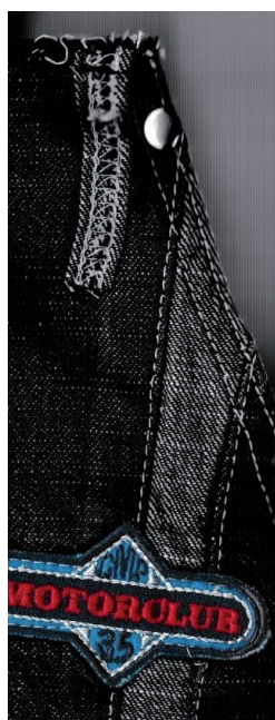
▲ Parte del davanti con l'entrata della tasca già rifinita. Interessante anche la fermatura dei passanti sul davanti, effettuata prima del montaggio della cintura.