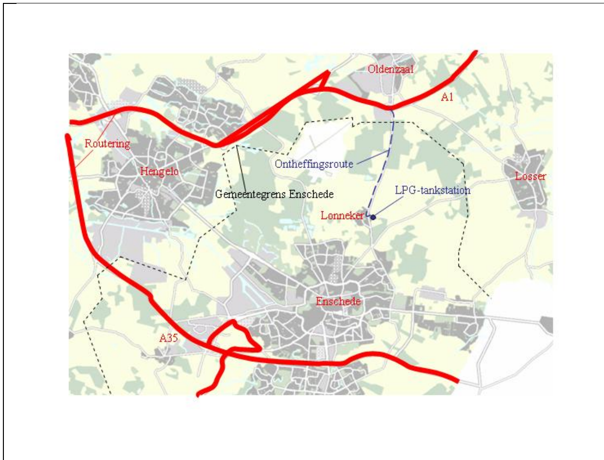
Figuur 1: Voorbeeld ontheffingsroute meerdere gemeenten - Enschede

Daarnaast kan er sprake zijn van bestemmingen die uitsluitend via een andere gemeente bereikt kunnen worden. Figuur 2 illustreert dit aan de hand van een LPG-station nabij Denekamp. Een eventuele ontheffingsroute loopt in alle gevallen via de gemeenten Losser en Oldenzaal.