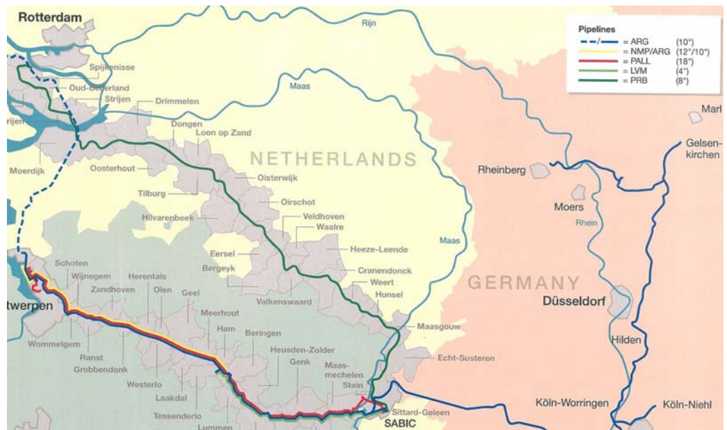
Tracé PRB (kaart van 15 mei 2007)

Op onderstaande kaart is het tracé in groen aangegeven. De buisleiding ligt deels solitair en deels in een bundel met andere buisleidingen (buisleidingstroken).