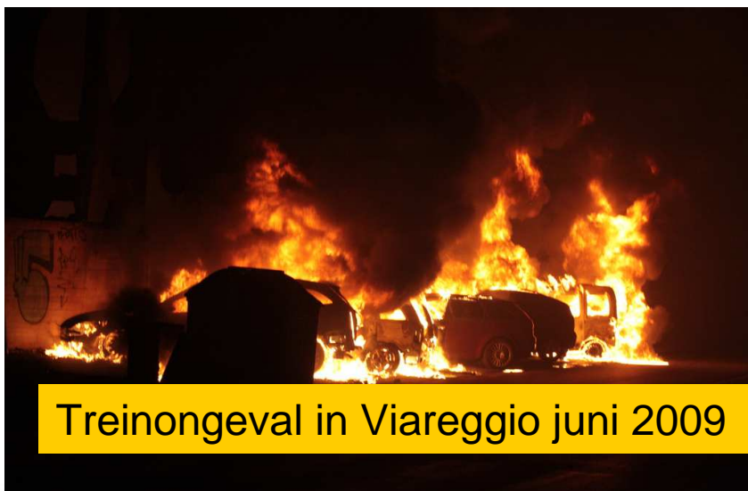
Treinongeval in Viareggio juni 2009