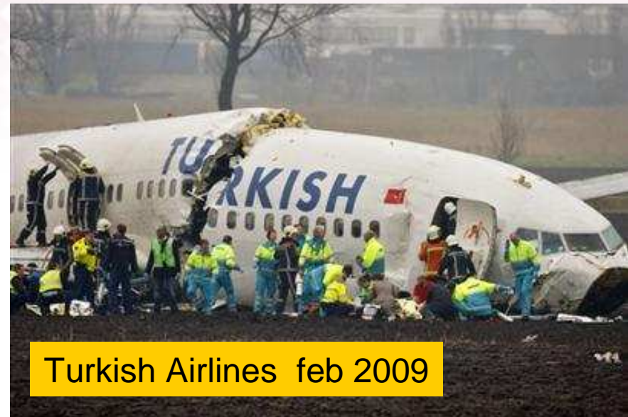
Turkish Airlines feb 2009