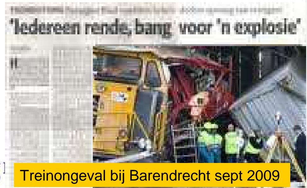
Treinongeval bij Barendrecht sept 2009