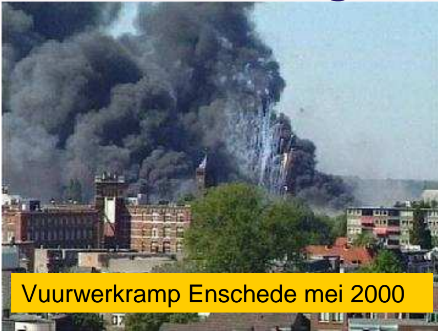
Vuurwerkkramp Enschede mei 2000