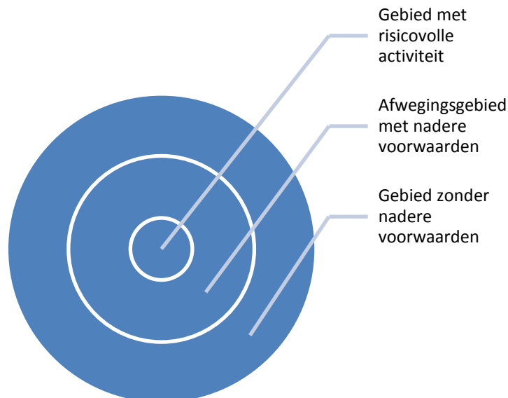
Figuur 2: schillenmodel

Door op de plankaart rondom een bestaande risicobron concrete gebieden op te nemen waar nadere voorwaarden aan de ruimtelijke inrichting zijn verbonden vanwege de omgevingsveiligheid, wordt bereikt dat omgevingsveiligheid vroeg in het planproces in beeld is. De initiatiefnemer komt deze informatie dan als kader tegen. Deze nadere voorwaarden kunnen uiteenlopen van algemene regels tot maatwerk in afstemming met de omgevingsdienst en/of veiligheidsregio. Daarbij kunnen bijvoorbeeld de beperkingen in de zelfredzaamheid van bewoners een rol spelen. Door rekening te houden met deze nadere voorwaarden kan een intrinsiek veiliger gebied of gebouw worden ontworpen (zie figuur 2: schillenmodel).